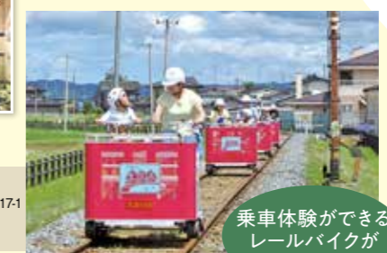
乗車体験ができるレールバイクが楽しい♪

平成19年まで市内を実際に走っていた「くりはら田園鉄道」の車両や資料が展示されているんだ。ミニチュアのくりでんが走るジオラマや実際に運転席に座って体験する運転シミュレーターで、楽しみながらくりでんの歴史を知ることができるよ。さらに本物のくりでんやレールバイクの乗車会も開催してるんだって～！