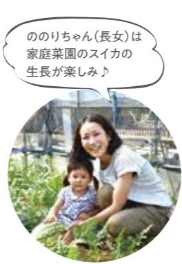
ののりちゃん（長女）は家庭菜園のスイカの生長が楽しみ♪

の移り変わりを肌で感じられます。それに家族で過ごす時間も増えたので、暮らしの充実感は東京にいた時よりもあります。