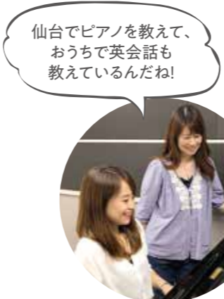
仙台でピアノを教えて、おうちで英会話も教えているんだね！

ヤマハミュージックサロン仙台で大人の方々にピアノを教えています。それと自宅で子どもたちに英語も教えていますよ。どっちも生徒さんたちがどんどん上手になってくれるから嬉しいですよ。月1〜2回、ピアニストとして仙台や栗原でジャズのライブもやっています。人との出会いが多いので、それが楽しいですね。 カフェ・コロポックルさんが、地元のピアニストということです。そこを拠点にやっています。