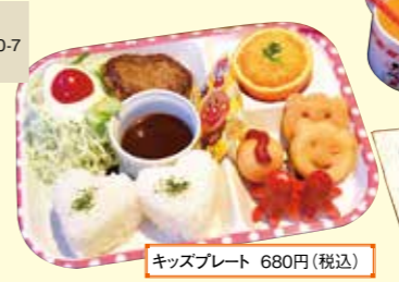
キッズプレート 680円(税込)

開放感のある吹き抜けがとってもお洒落なカフェ。メニューが充実しているからご家族で来ている人も多いんだって。ボクは「キッズプレート」を注文、タコさんウィンナーやハンバーグ、デザートが一度に食べられて大満足だったよ！店内では手づくりのアクセサリや陶器の販売も。