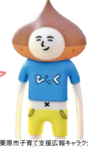
栗原市子育て支援広報キャラクター びっくり原くん