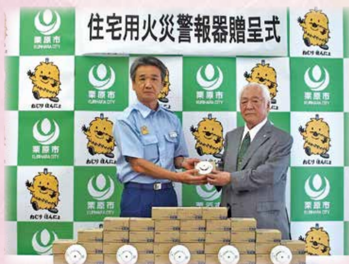
(一社) 宮城県消防設備協会より住宅用火災警報器寄贈