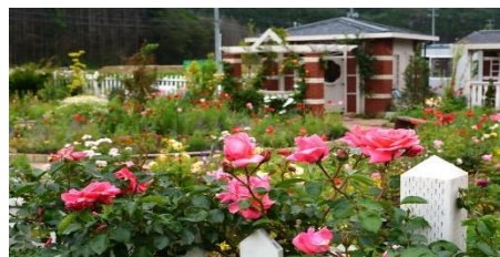
昨年度の「雄勝ファクトリーガーデン」移動研修