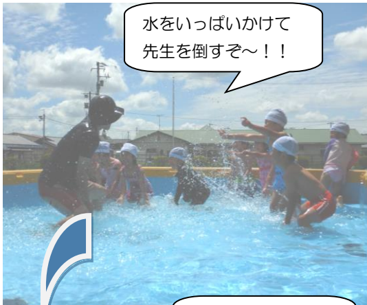
水をいっぱいかけて先生を倒すぞ～！！