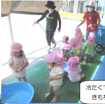
冷たくてきもちいい～♪