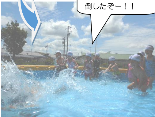
やったー！倒したぞー！！