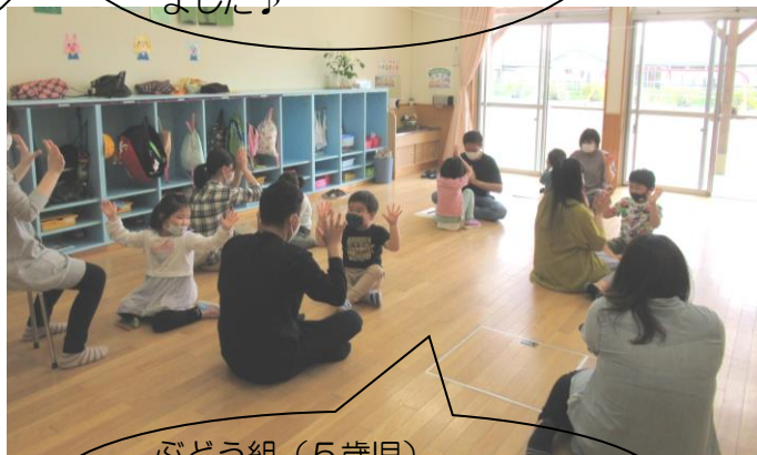
ぶどう組（5歳児） 親子でわらべうた遊びを楽し みました♪