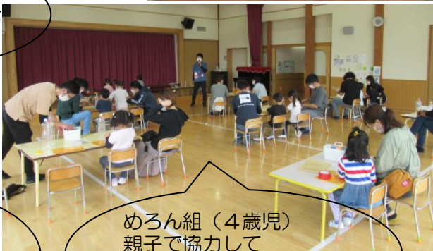
めろん組（4歳児） 親子で協力して 水・泥遊び用具を製作し ました♪