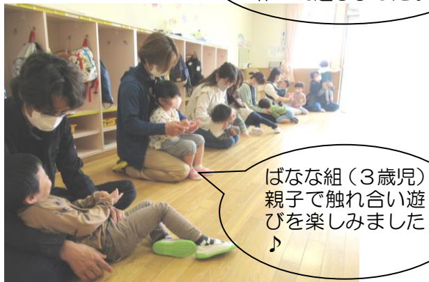
ばなな組（3歳児） 親子で触れ合い遊 びを楽しみました ♪