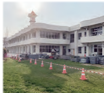
校舎の大規模改修を行っている若柳小学校