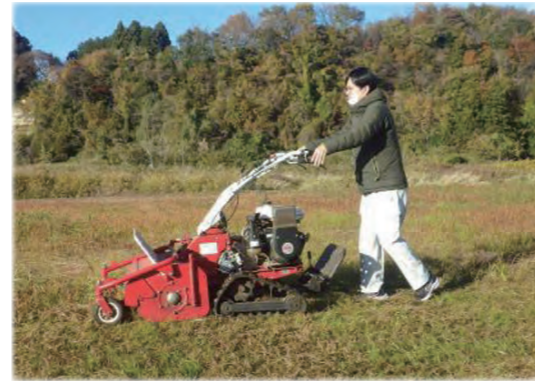
貸出しを行うハンマーナイフモア