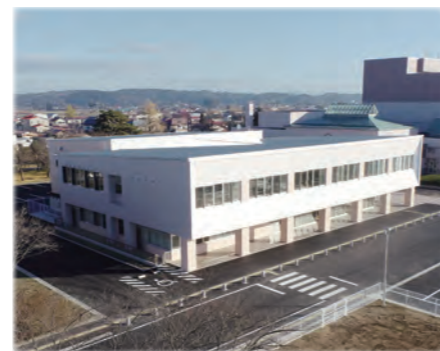
公衆無線 LAN を整備した若柳公民館