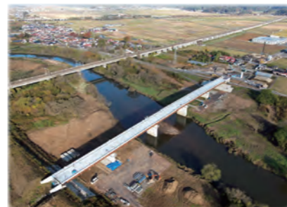
整備が進む(仮称)栗原東大橋