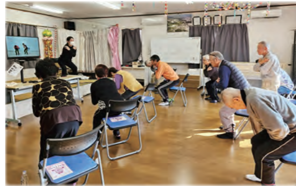
くりはら元気アップ体操