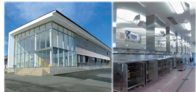
改修した南部学校給食センター