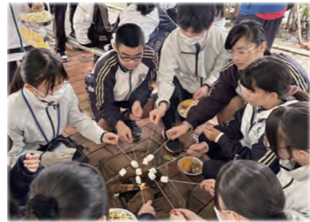
台湾での学校交流