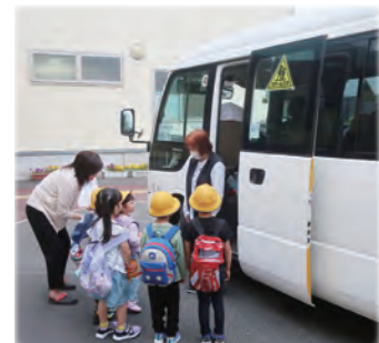
スクールバスでの送迎

安全でおいしい学校給食を安定して提供するため、設備改修や調理器具更新を行っています。