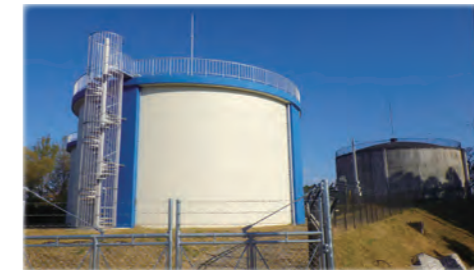
建替えした築館地区薬師山1号配水池

水道水を安定して供給するため、古くなった水道管などを更新するほか、施設を効率的に運用するため、施設の統廃合を進めています。