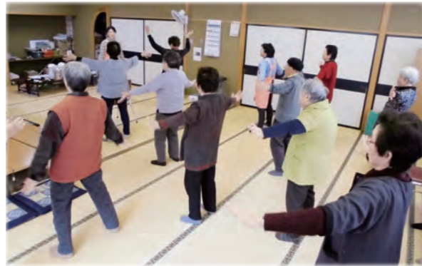
高齢者生きがい活動通所事業

要支援認定者等に対し、身体機能の維持・改善、介護予防及び自立支援に資するため、訪問型サービスや通所型サービスを提供しています。また、住民が主体となり、介護予防の取組みを継続して実践できるよう「くりはら元気アップ体操」などの普及推進、集いの場づくりの支援を行っています。