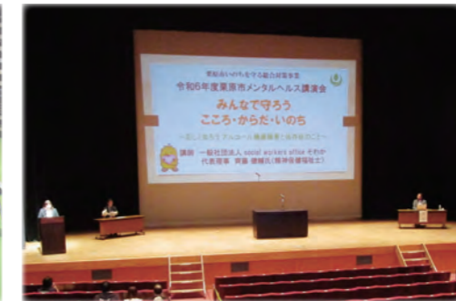
メンタルヘルス講演会