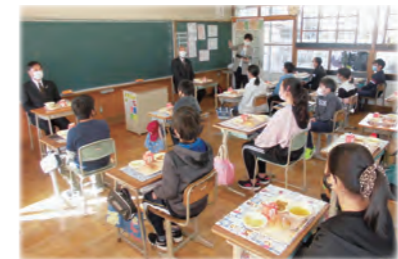
学校給食費無償化

乳幼児を対象としたおたふくかぜ、中学生までを対象としたインフルエンザの任意予防接種費用の全額助成を行っています。