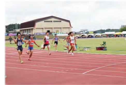
築館陸上競技場を会場とした陸上大会