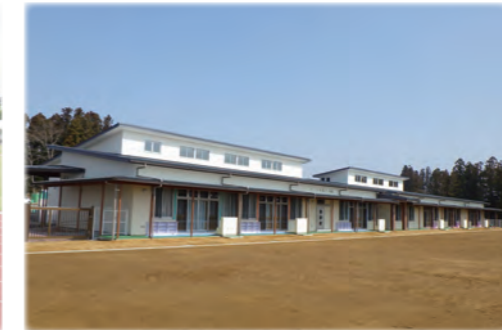
整備した瀬峰幼稚園・保育所・子育て支援センター

増加する核家族世帯や高齢者世帯に対応するため、保健、医療、福祉が一体となった施策に取り組み、市民が安心して暮らせるよう、地域全体で支え合う体制の構築や地域医療を支える人材を確保・育成することで、市民が安心して暮らせる医療体制を守ります。