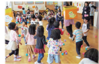
幼稚園預かり保育