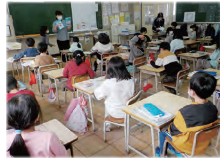
小学校及び義務教育学校前期課程での25人学級を推進

中学2年生等20人を姉妹都市である台湾南投市へ派遣し、現地生徒との交流を通して、国際感覚豊かな人材を育成しています。