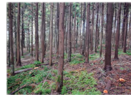
保育間伐実施後の森林

適切な管理が行われていなかった私有林(人工林)の森林管理を推進し、水源の保全、災害の防止、二酸化炭素の吸収など森林の持つ公益的機能の維持を図っています。