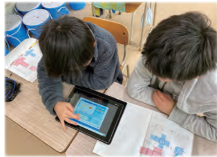
タブレット端末を使った授業