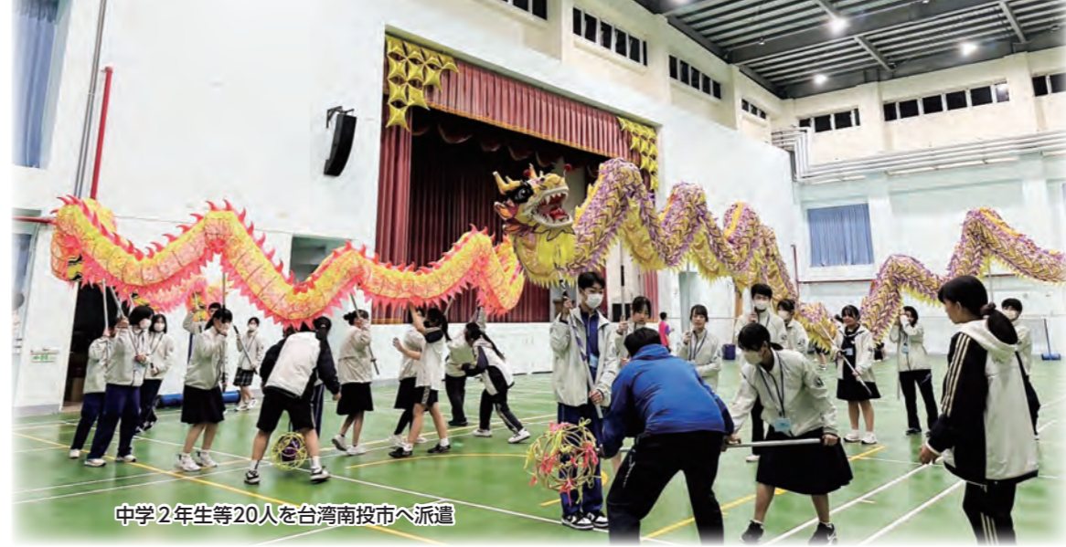
中学2年生等20人を台湾南投市へ派遣