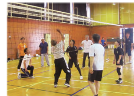
レクリエーション大会