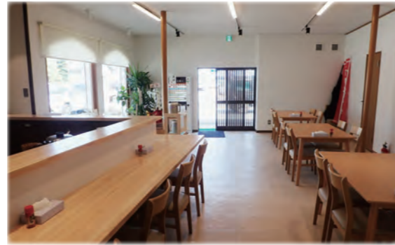
ビジネスチャレンジサポート事業を活用して改修した店舗