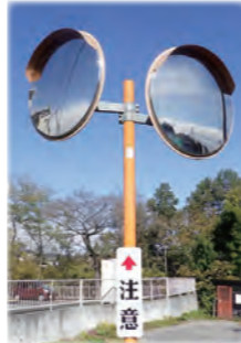
更新したカーブミラー

交通事故防止のため、カーブミラーやガードレールなどの整備のほか、防犯灯の移設や更新整備を行っています。