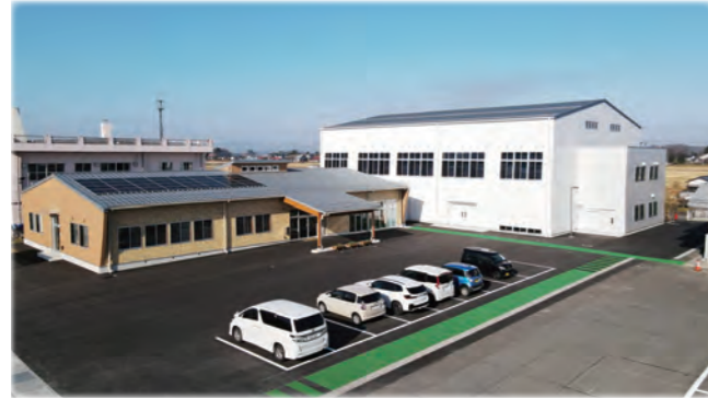
新築した志波姫公民館

市民が「いつでも どこでも だれでも」学べる生涯学習の拠点として、安心して利用できる公民館を整備しています。