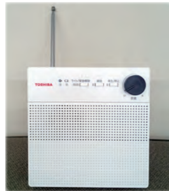
防災行政無線戸別受信機(写真上) と中継局(写真下)