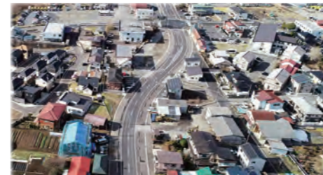
整備した都市計画道路一迫南線(築館)