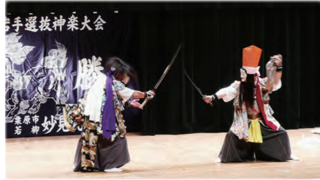
くりはら神楽まつり

伝統芸能活動の伝承育成及び普及啓発事業を支援し、地域に根ざした伝統芸能を守るための補助金を交付しています。