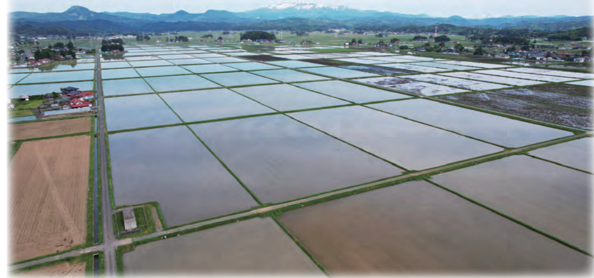
令和7年度完成予定の「ほ場整備事業(栗駒稲屋敷・鶯沢袋地区)」