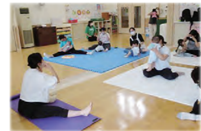
親子でのヨガ教室