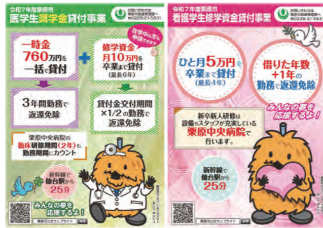
奨学資金等貸付パンフレット

栗原市立病院及び診療所に勤務する医師、看護師を確保するために、将来、栗原市立病院又は診療所に勤務しようとする医学生、看護学生に対し、修学に必要な資金の貸付を行っています。