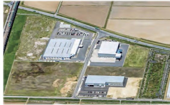
平成28年に分譲開始した若柳金成インター工業団地

新規開業に係る初期投資の負担を軽減するため、店舗等の賃貸料や改修・設備導入に要する経費の一部を助成しています。