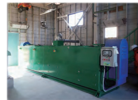
鶯沢地区に設置した有害鳥獣減容化処理施設

農業・農村が有する国土の保全や水源のかん養、自然環境の保全や良好な景観の形成などの多面的機能を維持・発揮するため、農地等の保管理に係る、共同活動に対して交付金を交付しています。