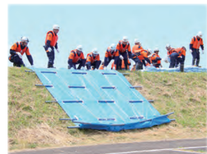
栗原市総合防災訓練