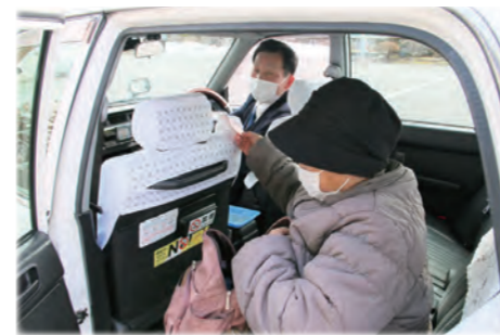
令和6年4月から導入したタクシー利用助成事業

安全で快適な移動サービスの提供と地域交通の利便性の向上のため、タクシー利用助成を行っています。