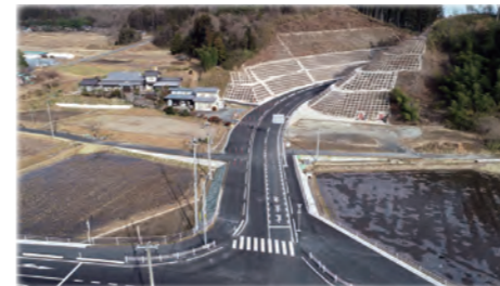
整備した市道長崎細倉線(一迫)