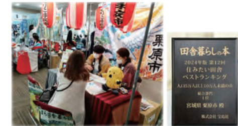
東北移住&つながり大相談会(写真左) 住みたい田舎ベストランキング第1位の盾(写真右)

東京・仙台でのくりはらオフィスの開設や、移住定住コンシェルジュ等と連携した移住相談、移住定住支援員の設置、移住後のサポートを行っています。