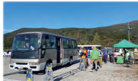
栗駒山でのシャトルバス運行

栗駒山麓ジオパークの拠点施設となるビジターセンターの展示の充実を図っています。また、栗原の貴重な地質資源などを、子ども達へのジオパーク学習や、ガイド養成、ジオを体感できるプログラムなどに広く活用しながら、栗駒山麓ジオパーク活動を推進しています。