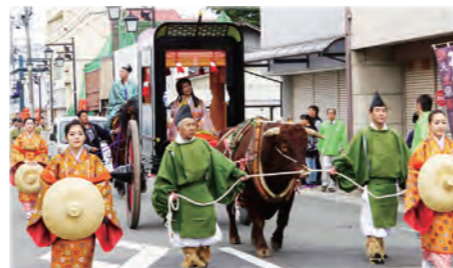
つきだて薬師まつり