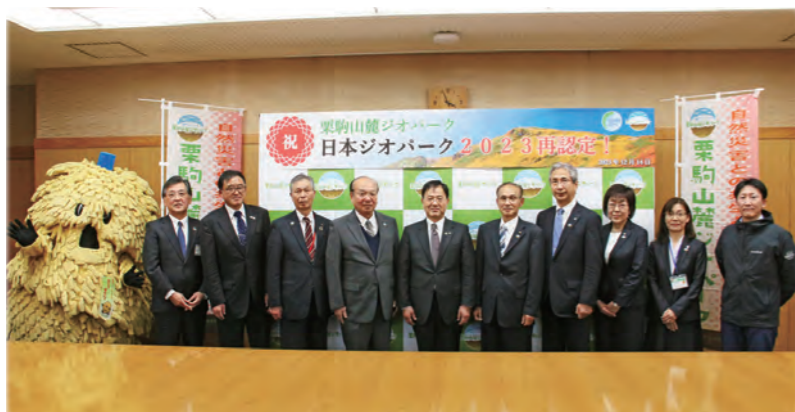
日本ジオパーク再認定(令和5年)

栗原市の基幹産業である農業を強化するため、経営感覚を備えた農業者の育成や生産基盤の強化を進めています。また、高速交通網の利便性を活用して企業誘致を促進し、既存企業との連携を深めることで、産業拠点を形成するとともに、地域資源を再発見・活用する「田園観光都市」づくりを進め、国内外から多くの人が訪れる賑わいの創出に取り組みます。