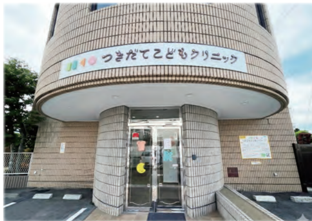
市内に開設した小児科医院

栗原市に産婦人科及び小児科医療施設を開設しようとする医師等に対し、開設に要する経費の一部を助成しています。