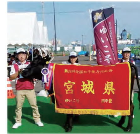
全国和牛能力共進会宮城大会の表彰牛

栗原市内で生産され、父牛が栗原産の宮城県基幹種雄牛の優秀な繁殖素牛や肥育素牛をみやぎ総合家畜市場から導入した方に補助金を交付しています。