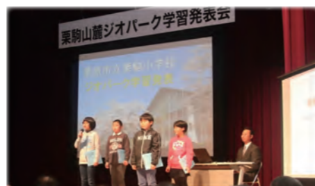
栗駒山麓ジオパーク学習発表会