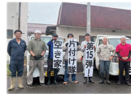
活動する地域おこし協力隊