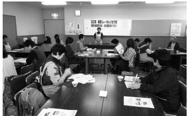
▲つどいで、女性農業委員の活動を話す