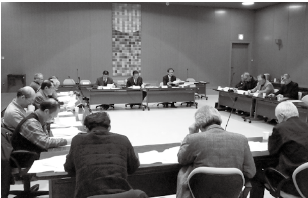
▲委託者や受託者で検討

※ 設定理由 …花山地区において農地等の利用状況や将来の見通しからみて、新機就農を促進する観点から適当と認められる ※ 下限面積 …農地法第3条許可申請で農地の権利取得後に必要な耕作面積の要件