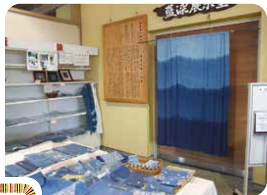
藍染作品の販売や地元食材を使った料理を提供