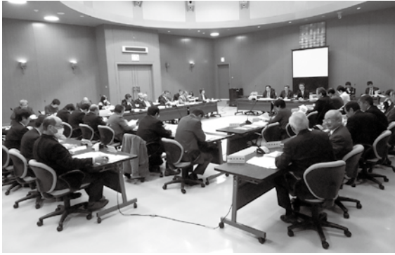
▲総会で審議されました