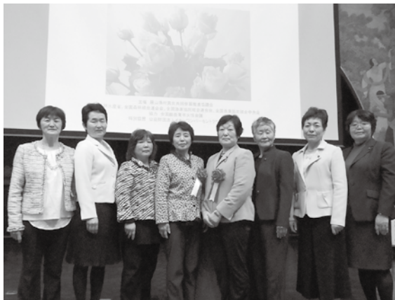
▶男女共同参画優良活動表彰式に女性農業委員全員で出席