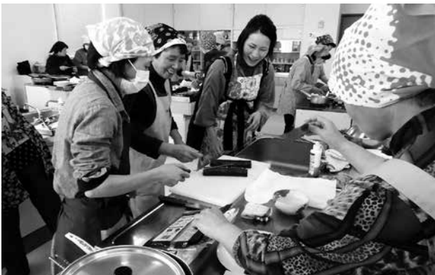
▲若い女性農業者と料理を通しての交流