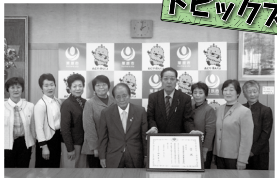
▶栗原市長へ「農林水産大臣賞」の受賞報告し、市議会議長へも報告した。