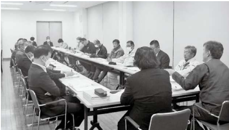
地域計画説明会の様子（一迫地区）

地域計画は地域の話し合いが重要であり、今後も担い手を中心に話し合うための会議等を随時開催してまいります。地域計画についてのご質問や意見等がございましたら、下記まで問合せをお願いします。