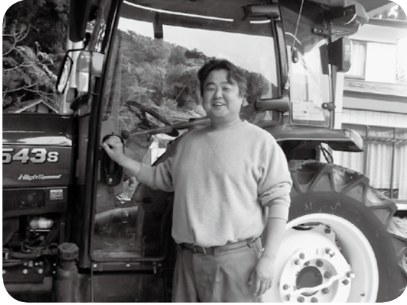
(取材 菅原勝宏委員)

「米価の下落により、経営をしていくためには効率良い作業が求められる。耕作地の集積、近代化大型機械の導入、コスト削減といろいろな面から考え経営していかなくてはならない。」と語っていました。