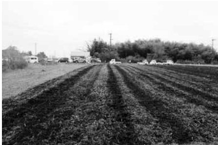
▶耕起をし、美しい畑によみがえりました。