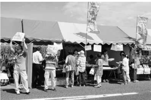
▲市民まつりの様子

農業委員会のブースでは、農業者年金の普及推進と栗原の特産の一つであるズッキーニの消費拡大をねらった、スूप、パンケーキ、蒸しパンをとろ狭しと並べてPRに奮闘しました。前日から、女性委員みんなで準備をした甲斐があり、試食された方々からは「簡単に手軽に作れるし、とてもおいしい。」と大好評でした。