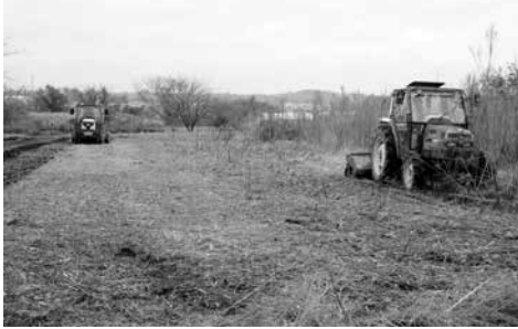
▶フレールモア、スライドモアで整地をしています。