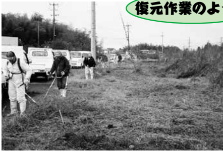
▲荒廃農地の復元作業にとりかかります。