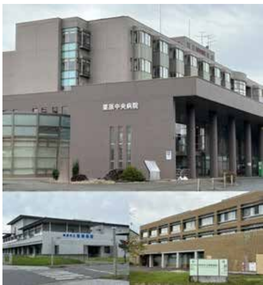
再編不可欠、市立3病院

はない。現状の認識は。 A 患者数の減少に加え、近年の物価高騰や人件費の増加に対して診療報酬が十分に反映されておらず、病院経営は非常に厳しい状況にあると認識している。 Q 10年後を見据えた医療体制の構築が必要不可欠と考えるがどうか。 A 若柳病院と栗駒病院の無床診療所化など、段階的な再編を柔軟かつ迅速に進