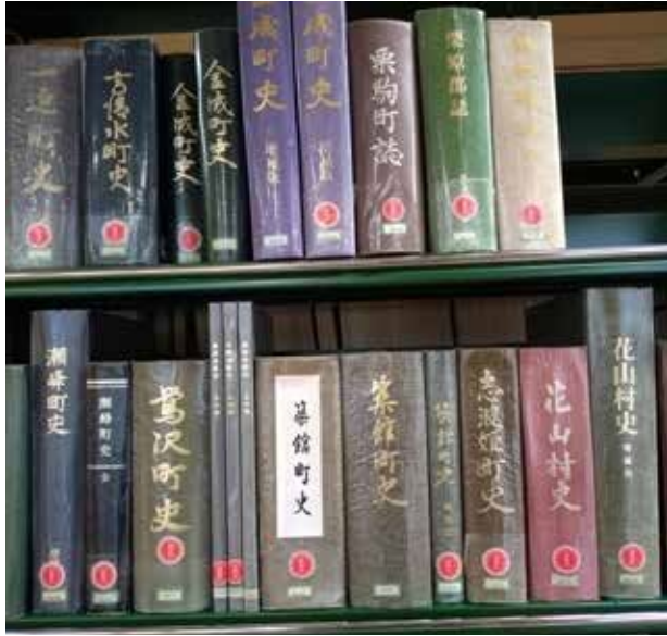
増補版発行が待たれる旧6町史

Q 栗原市合併20周年記念誌編さん発行の進捗状況は A 栗原市誕生20周年記念誌は、広報くりはら1月号に合わせて毎戸配布を行う。