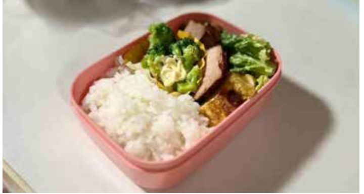
おかずに悩むお弁当

Q 長期の休業（夏休み・冬休み）中の放課後児童クラブの昼食は現在、弁当持参となっている。他自治体では弁当業者が届けるところや、給食センターを活用しているところもある。 A 給食センターを活用した昼食提供は考えているのか。 A 夏休みから市販弁当の持ち込みは一定のルールを作ったとしても、給食センターを活用した提供については、他自治体を参考に検討したい。