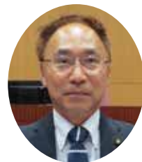
すがわら なおと 菅原 なおと 議員

Q 観光振興ビジョンで効果のあった取り組みは。 A 観光戦略会議を設置し連携基盤を構築した。食の開発や台湾営業によりインバウンドはコロナ前の水準に戻った。ジオトレイル造 Q 成なども成果を上げている。新たに顕在化した課題は。 A 資源を体系的に発信するストーリー性が必要だ。観光物産協会が主導し、販売網の解決や民間主導型の仕組みづくりに力を入れる。 Q 地域再生マネージャー事業の成果は。 A アウトドア食開発などに取り組んだ。課題は開発した商品の販路拡大など