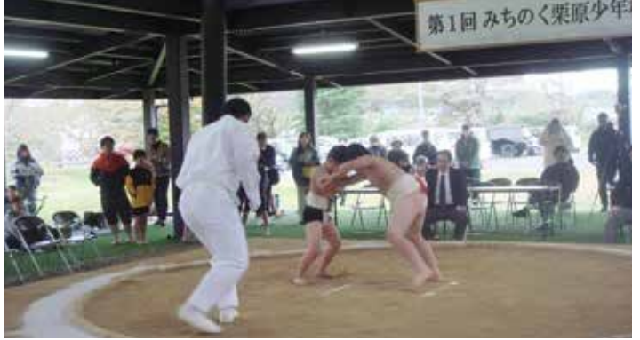
第1回みちのく栗原少年相撲大会

Q みちのく伝創館の隣にある栗原市相撲場は、令和7年に改修工事が終了し、10月には第1回みちのく栗原少年相撲大会が、肌寒い中で開催されている。保護者や相撲関係者からは風邪を心配する声や管理上、シャッターなどで囲う事を求める声があるがどうか。