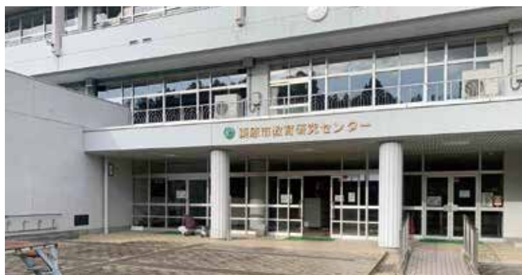
子どもの学び支援センター

Q 不登校や学校に馴染めない子どもたちのために「学びの庭プロジェクト」の立ち上げを検討している団体があるが、教育委員会としての関わりや考え方、考えられる支援はあるか。 A 不登校児童生徒数は全国的には増加傾向にあるが、市内では低い水準で推移している。これは医療・福祉・教育が一体となった支援の成果の一つと捉えている。「学びの庭プロジェクト」