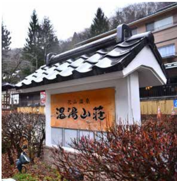
にぎわいを見せる花山の温泉施設

なお、台湾の南投市と友好姉妹都市を結んでいるので、より楽しんでもらえる周遊ルートを考えたい。