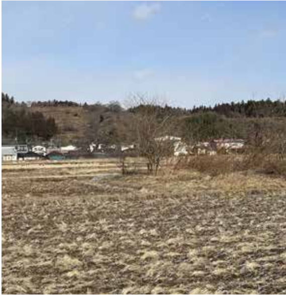
耕作放棄により木が生えた農地

Q 市内の農業従事者は70歳以上が50%を超え、農業後継者の確保率は40%に届かない現状だが、新規就農者の数は。 A 令和4年7人、5年4人、6年11人。令和7年の