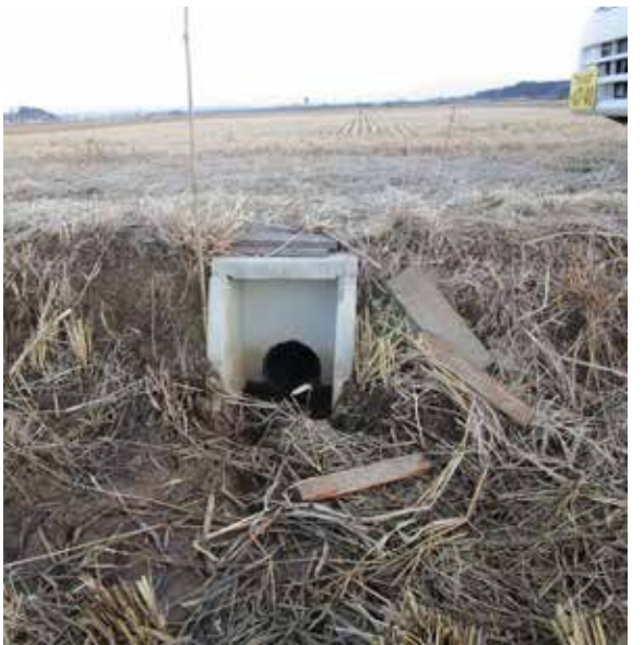
改良された排水樹設置が望まれる

A 市では令和3年に「栗原市職員のハラスメントの防止等に関する要綱」を制定し、相談窓口の設置やハラスメントに対する任命権者、所属長および職員の責務を明確にし、相談者の意向を最大限尊重しプライバシー保護の徹底、相談内容の秘密保持など厳格な運用に努めている。相談者の匿名性や安全性を確保するため外部相談窓口は有効な方法の一つと捉えており、設置に向け検討を進めている。