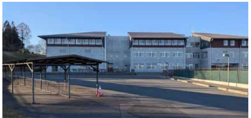
栗原市立金成小中学校

Q 金成小中学校は、小中一貫校となつてから11年が経過しているが、どのように評価しているか。 A 義務教育学校として小学校と中学校の教職員が連携し、児童生徒の発達段階に応じた教育課程の編成や、学力・体力の向上、家庭と連携した生活習慣の定着などに取り組んでおり、後期課程の教員が前期課程の授