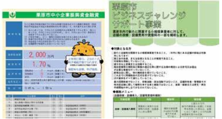
市の中小企業向け支援制度の一部

Q 栗原市には農業や畜産業などに対して、さまざまな支援制度がある一方、中小商工業者への直接支援制度がほとんど無い。お客様の要望に応えるため店舗の改装を進めたくても活用できない制度が無い。近隣自治体のように、中小商工業者向けの持続化補助金のような市独自支援制度を創設する考えは無いのか。