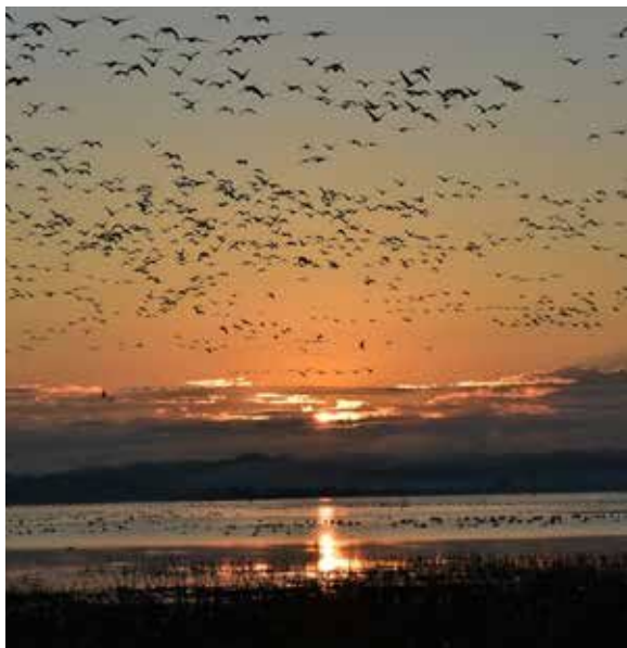
世界的価値のある伊豆沼・内沼

Q 以前も質問したが、給食の地場産品の活用について、農家との協力体制や連携を深める考えはあるのか。 A 一定の品質と量を継続的に確保する必要があるため、地元農家と直接の協力体制や連携の仕組みは設けていない。 Q 農家やJAから食材利用についての提案はあるのか。また、市から働きかけはしているのか。 A 現時点では、特段の提案はもらっていない。市からも働きかけはしていないが、納入業者には可能な限り栗原産の食材を使用してもらえようように協力をお願いしている。 Q 市政20周年記念事業の交付金は好評で多くの申請があると聞いた。新規事業、継続事業それぞれの申請件数は何件か。 A 11月末で新規事業21件、継続事業70件である。 Q 新規事業に対してだけでも、来年度以降交付する考えはないか。 A 地域のにぎわいや公益性の向上につながる取り組みは喜ばしいため、支援する仕組みを検討する。