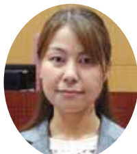
かとう 桂子 議員