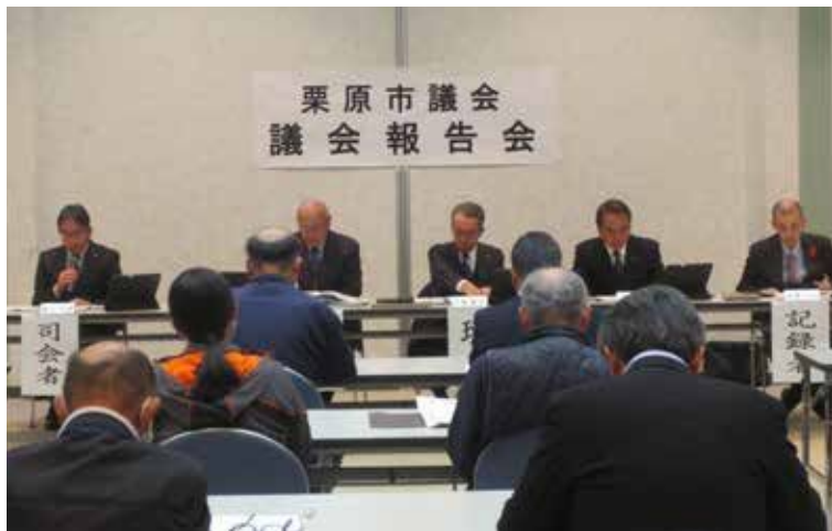
議会報告会の様子