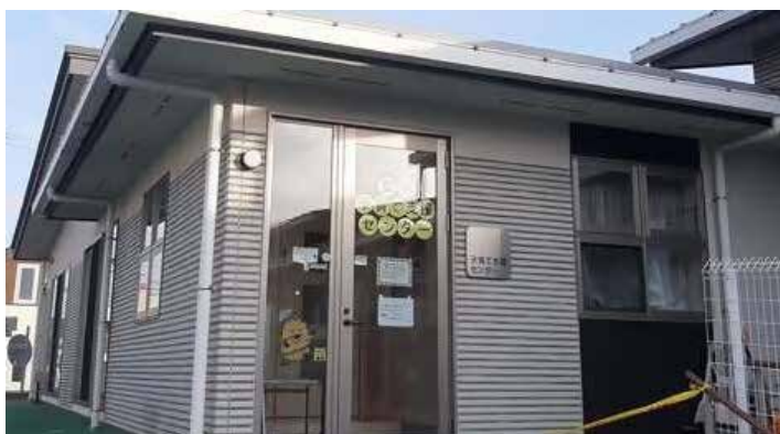
築館地区子育て支援センター