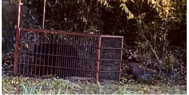
箱わなで捕獲されたクマ

Q 鳥獣被害対策実施隊員の怪我などに対する補償と緊急銃猟時補償費用保険の補償内容は。 A 猟銃を使った活動中の怪我を補償するハンター保険に加入。また、非常勤職員公務災害補償保険も対象となっている。緊急銃猟中に建物などの財産を損壊した場合、事故あたり3千万円を上限に補償し、人身被害は国家賠償法が適用される。