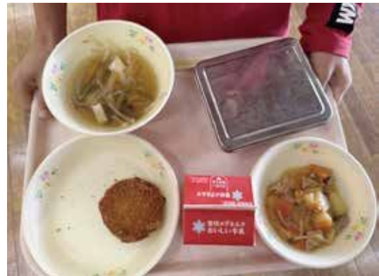
小学校（低学年）の給食