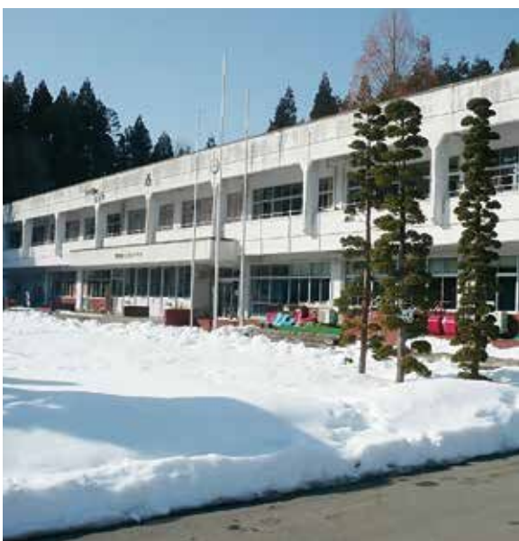
現在の花山小学校

A 令和8年度に在籍見込み児童の保護者への説明を行い、今後の在り方を検討するが、学びの多様な学校を現在の場所に設置する方向で準備を進めている。