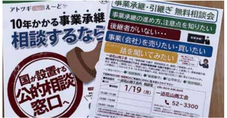
承継補助金は商工会が窓口

Q 市事業承継補助金の利用が伸びない理由は、 A 事業拡大まで至らず現状維持での承継が多いため活用につづきにくい状況 Q より活用しやすい補助金にする考えは。 A 社会情勢に合わせた活用しやすい補助金の見直しを検討する。 Q 少人数学級の教員配置 Q 教員はどういう基準で配置されているのか。