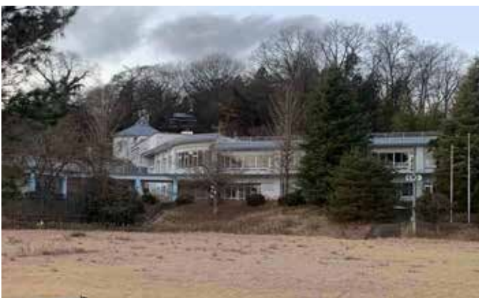
解体される旧畑岡小学校