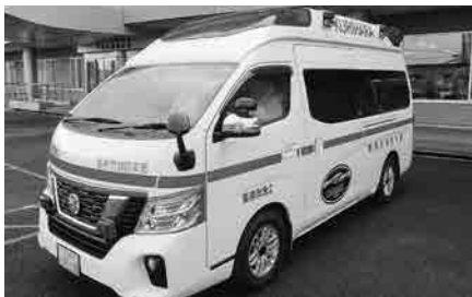
高規格救急自動車（イメージ）

方法 指名競争入札 金額 2114万円 相手方 日産プリンス宮城販売株式会社 (仙台市)