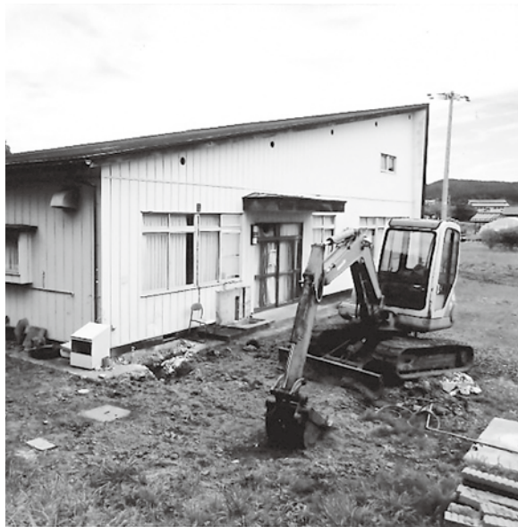
解体間近の集会施設

議員 令和4年度事業の追加助成の内訳と算定根拠は、 市長 5施設建築面積区分に応じ、合計506万円追加、算定根拠は市営住宅建築に占める木材の割合を参考に6・6%と算出し、梁材を一番高い米松として、