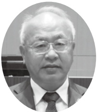
すがわら ゆうき 議員 菅原 勇喜