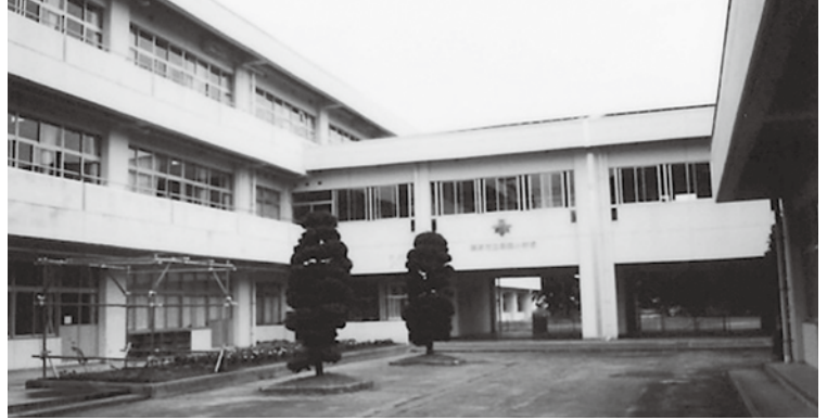
きめ細かな授業を展開

議員 市長の公約である25人学級推進事業については、小学校および義務教育学校1・2年生は25人を標準とし、その他の学年は35人を標準とする学級再編成であるが、この事業費は全て市の財源である。市の財政が厳しさを増している状況において、この事業の主旨がはつきりと示されていない。