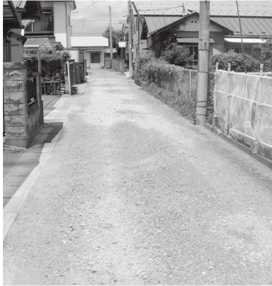
住宅地内を巡る私道（築館伊豆地内）

議員 私有地を生活道路として共同利用されている個所はどのくらいあるのか。 市長 合併後これまでに寄附の申出や舗装などの相談は10件ほどあったが、全体数は把握していない。