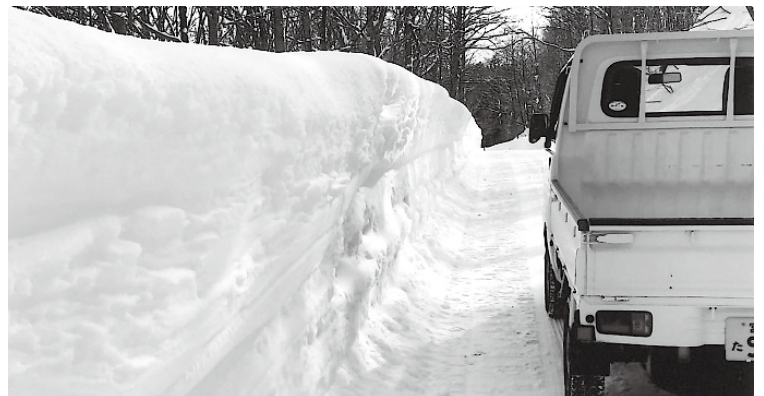
冬でも安全な道にしたい

議員 今や巨大都市を除けば右肩下がり時代の。企業誘致の取り組みは。 市長 令和3年度に株式会社DIGテクノロジーズを誘致した。首都圏、関西圏にも企業訪問している。 議員 閉校した小中学校の活用は進んでいるか。 市長 教育施設としての利用を検討し、次に他用途の利用を検討する。利用がなければ売却や貸付を行う。 議員 思い切って安くして