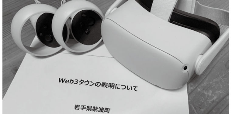
岩手県紫波町でWeb3タウンが表明された

議員 国では地方の少子高齢化、過疎化を解決する鍵としてWeb3推進の方針だ。日本全体が人口減少にあり、移住によるパイの奪い合いは根本解決ではない。本市の活動力を維持発展させるには、外部人材の能力活用が重要だ。Web3を用いることで地域を超えて人を繋ぎ地域活性へ繋げ。他市で事例が少ない、今こそがメリットを受け取れる最大のタイミングのため、