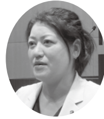
菅原 麻紀 議員