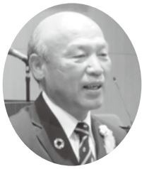
みつづか あきら 議員 三塚 東