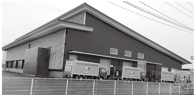
おいしい給食を作り届ける「給食センター」

②国の施策として行う事業であるが、国への実施働きかけはどのように行うのか。 市長 ①給食費をいったんご負担いただいた上で、地域通貨により還元するという手法を検討している。