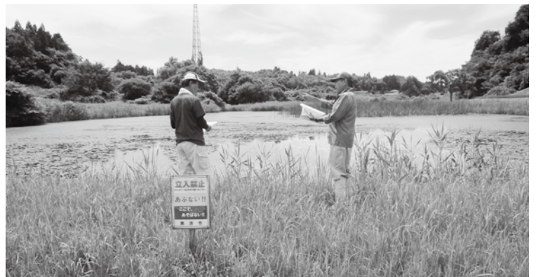
ため池の安全対策確認に回る地区民

そのことをもって総合支所の対応が悪かったと断言した。総合支所にはさまざまな事案を判断して対応するためにどれほどの権限が与えられているか。また、予算配分はいかほどか。