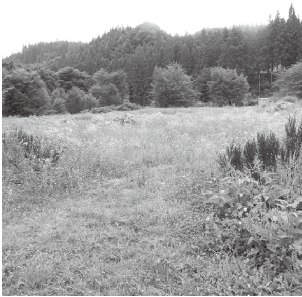
上田山苗圃跡地をパークゴルフ場に

市長 令和4年度も土砂撤去を行う。今後も河川管理維持管理に努めたい。 議員 4月28日の河北新報の記事で、救急車が来て出発するまで40分の時間を要したとのことである。改善することは不可能なのか市長の見解を聞く。 市長 県が定める救急搬送実施基準に基づいて、病態などにより搬送する医療機関の選定を行っており、県や医療機関と協議しながら搬送時間の短縮に努める。 議員 令和3年9月定例会で一般質問しているが、有賀沢の用水路の件は、その後どうなっているか市長の見解を聞く。 市長 平成29年度と30年度に延長1482mの整備が完了し、進捗率は57・4%である。第2工区の延長、1100mについては、補助事業の年次計画などを調整しながら、引き続き整備を進めていく。