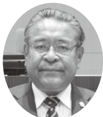
さわべ ゆきひろ 議員 澤邊 幸浩