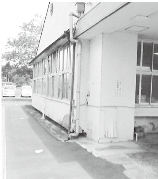
老朽化が進む「萩野診療所」

議員 診療所の件で地域住民からの要望書があったと思うが、その対応は。 市長 老朽化や施設移転の要望書や意見を行政区長からもらっているところである。医療継続のため今後も期待しているところで、機会をとらえ先生の考えを聞きに行きたいと考えている。