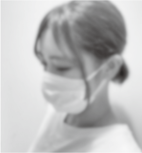
体調を優先しマスク着用を

教育長 マスクの着用は十分な身体的距離が確保できる場合や体育、登下校などにおいて着用は必要ない。