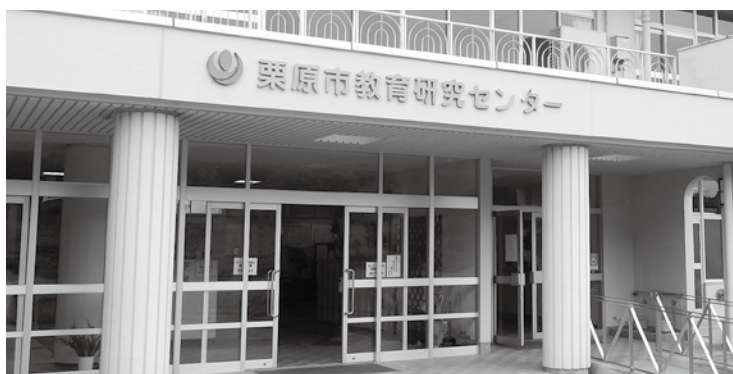
生きる力を育む「学府くりはら」

議員 昨今の子どもたちを取り巻く社会環境を鑑みると、いじめ、学力格差、SNSなどでの情報氾濫など、「二こころの問題」は喫緊の課題といえる。「子どもたちに生きる力を育む」ために、偏差値や学力テストの点数だけにとらわれない、生きる力を育む「学府くりはら」独自の教育を施す必要があるのではないかと。 教育長 各学校においては、生きる力を確実に育成する