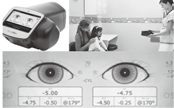
フォトスクリーナー（イメージ）

議員 メガネなどを使っても十分な視力が得られない弱視の子どもは50人に1人ほどいるとされ、目の機能が発達する6歳ごろまでの早期発見・治療が欠かせない。弱視の発見には3歳児健診の際、専用機器を用いて屈折異常（ピントのずれ）などを調べる「屈折検査」が有効だといわれる。①3歳児健診における弱視の見逃しは起きていないか。②保護者へ視力検査（屈折