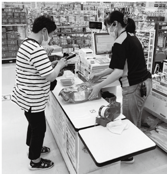
地場産品・生活用品も地域通貨でお買い物

民の44・4%が市外で買い物をしている。地域の活性化を図るには、地域内での消費購買額を増やし経済を循環させることが喫緊の課題であり、地域通貨は特定の地域やコミュニティ内だけで利用できるもので、地域経済や地域コミュニティを活性化させる効果が期待される。現金チャージや買入物をした際に付与されるプレミアムポイントのほか、