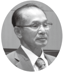
たかはし わたる 議員 高橋 渉