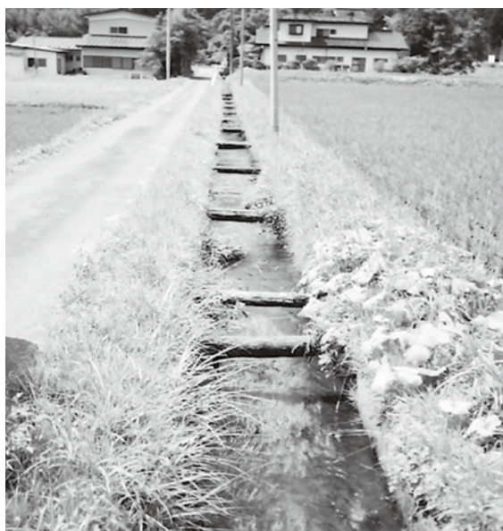
早急に改修が望まれる水路（つかえ棒で保護）

議員 生活道路整備は、市民の最優先要望でもある。今後も国の交付金はじめ年度内予算組み替えなどにより、早期整備に努めるべきと考えるが。 市長 生活道路の維持補修