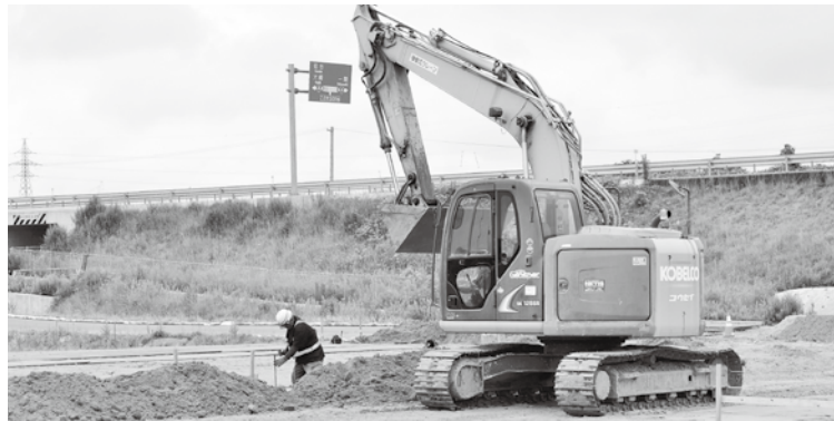
道の駅に適す交通の要所

議員 国道4号バイパス、東北高速幹線道路、東北自動車道の接点となる所に、市内3か所目となる（仮称）栗原インターチェンジが、55億円を投じ完成に向け工事が進んでいる。高速体系にこれほど恵まれていることは強みであり、最大限の活用策として、交流人口増や地域活性化のよりどころになる施設、道の駅が一番ふさわしいと思うが、