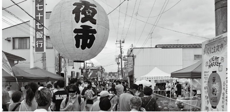
若者の創造力が街並みを活性化

議員 若者の政策を推進するため、若者の意思や意見が伝わる機会を確保し、若者が自ら行動することで若者が活躍できるまちづくりを目指した「若者議会」を開催すべきではないか。 市長 市政に次代を担う若者の新しい観点や発想を反映させることは、「市民が創る」くらしたい栗原の実現につながると思料する。市はこれまで、まちづくりの総合計画などの策定で