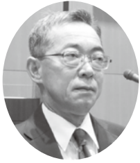
みうら よしひろ 議員 三浦 善浩