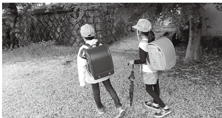
今日も元気に登校

議員 ①不登校の現状・要因・解消策。②不登校特例校の現状。③「栗原ともに学び合う会」への支援。④一迫商業高校の今後の方向性が年度内に示される。中学校の進路指導、高校魅力化プロジェクトの設置はどうか。 教育長 ①30日以上欠席のうち不登校は小学校15人、中学校83人。「生活リズムの乱れ」、「無気力・不安」、「友人関係」など。生