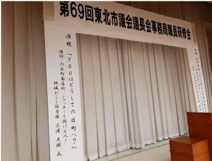
東北市議会議長会事務局職員研修会

東北市議会議長会事務局職員研修会、みやぎIJUカフェコーヒー、栗駒小学校の4年生の児童を対象にしたものなど、様々な機会をいただき、商店街の近況についてお話ししました。