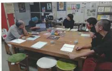
協力隊ミーティング

全国各地の(当)地ラーメンや駄菓子を扱う「にじくじら商店」など、個性あふれるお店が次々にオープンしています。 また、三浦酒舗や岡本老舗など、古くから営業を続けているお店では息子さんが帰ってきてお店に立つ姿も見られるようになってきました。 「(株)かいめんこや」オープンの翌年に、地域おこし協力隊制度を活用して最初の隊員を商店街に呼びました。商店街の空き店舗調査に呼び組みみなさんとのやり取りを重ねて、貸し出しができる空き店舗を情報発信できるようになり、お店を開業したい人への物件紹介やマッチン