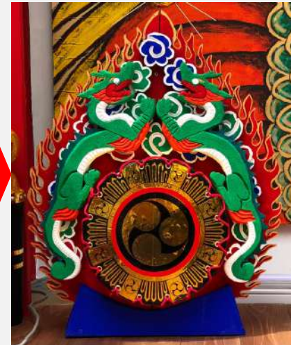
担当した制作物が出来上がる様子