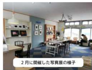
2月に開催した写真展の様子

グなどに取り組ましました。 続く二代目の隊員は開業のための勉強会を企画して、事業計画の書き方などの様々な分野に特化した講師を呼んで、同じ志をもった人を集めて開催しました。 また、お店の実践づくり講座として、断熱材を入れたり壁を貼ったりして、「六日町ナマケモノ書店」を作り、今年三月の任期終了後も営業を続けています。書店の裏には、シェアショップとか女漫画などを集めた図書室を兼ねた交流スペースを整備して、人と人がつながる場所になっています。 現在は私三代目と、今年四月に新