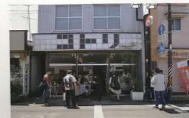
栗駒コトトリオープン (六日町)

グなどに取り組ましました。 続く二代目の隊員は開業のための勉強会を企画して、事業計画の書き方などの様々な分野に特化した講師を呼んで、同じ志をもった人を集めて開催しました。 また、お店の実践づくり講座として、断熱材を入れたり壁を貼ったりして、「六日町ナマケモノ書店」を作り、今年三月の任期終了後も営業を続けています。書店の裏には、シェアショップとか女漫画などを集めた図書室を兼ねた交流スペースを整備して、人と人がつながる場所になっています。 現在は私三代目と、今年四月に新