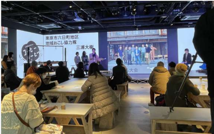
みやぎIJUカフェコーヒー