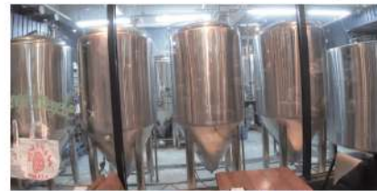
ビール醸造設備。2 千万すると言われ吐きそうになりました。

栗駒小学校にて 2 年生への講話 2 月 1 日に栗駒小学校 4 年生の皆さん向けに、菅原六日町通り商店街会長と共に講話をさせて頂きました。地域おこし協力隊になった経緯や、