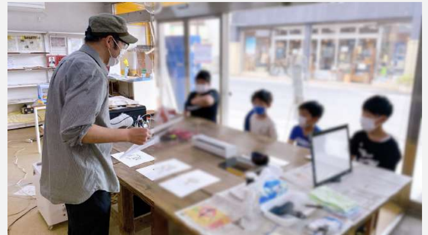
ワークショップの様子

任期終了後に開業を検討している市民工作室のニーズ調査を兼ねて、子どもを対象にした体験教室を企画運営。レーザーカッターを使ったオリジナルコースター作り、シルクスクリーンの体験会など、複数のメニューを準備。