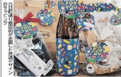
六日町通り商店街が企画した共通デザインのラッピング。

空き店舗に看するの新規 通のラッピングサービスを などのプレゼントを購入し、出店が相次ぐ栗原市栗駒 表施している。普段の買い物だけだなく、クリスマスなどのラッピングを発売する。来坪ヨ未ま