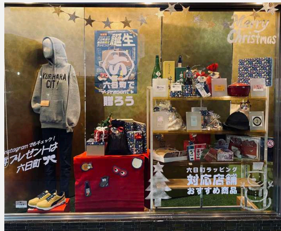
協力隊事務所に設置のショーウィンドウの装飾