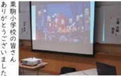
栗駒小学校の皆さんありがとうございました。

んな活動をしているか等の話をしました。一番面白いのが夢の話です。経験なし、お金なしで挑戦する、栗原にクラフトビール醸造所を造りたいという夢、「のび太は海賊王になれる」とお話