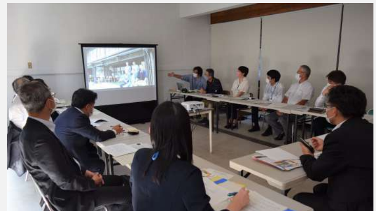
宮城県議員の視察対応の様子（8月）

昨年度多くの視察申込みがあったことを受けて、商店街の視察有料化を整備しました。視察の日時、どんなことを聞きたいのかなどの項目を設けた、専用の申込みフォームを商店街のホームページに新しく追加しました。