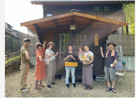
2022年7月 仙台物産販売 有壁街歩き