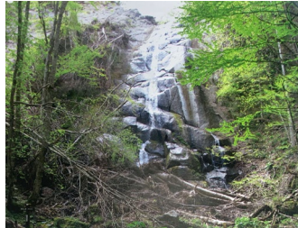
平成21年・震災後の様子