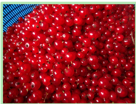
収穫されたふさすぐり！ きれいなルビー色です

また、昨年度に引き続き、今年も収穫時期にあわせて、ふさすぐり援農が行われました。ふさすぐりを利用している市内や仙台の洋菓子店の方々に圃場で収穫していただきました。