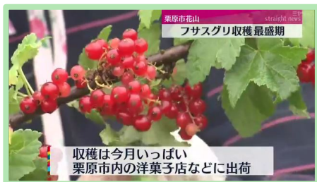
ミヤギテレビ「news every.」での 放映の様子