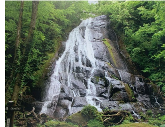
平成16年・震災以前の様子