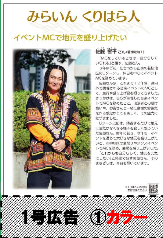
広告掲載イメージ図 2