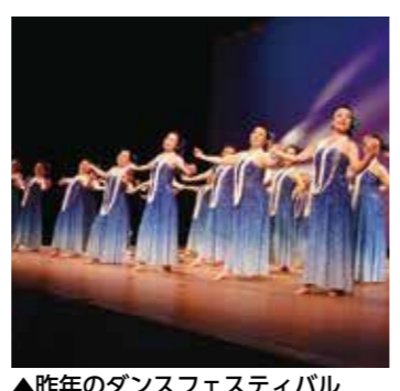
▲昨年のダンスフェスティバル

※チケットが売完した場合、当日券は販売しません。 ●若柳ドリーム・パル ☎(32)6600 食品測定を希望する人は、問い合わせ先に申し込みください。 ●測定内容 食品の放射性物質測定 ※市内の空間放射線量は、市ウェブサイトで確認してください。 ●産業経済部 林業畜産課 放射性廃棄物対策室 ☎(22)1136