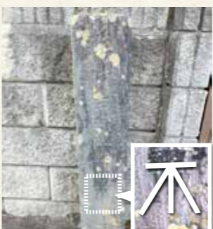
高清水善光寺の車道入口北側にある凡号高低標

今から150年前の明治9年(1876年)に、内務省は東京の豊島から宮城県の塩竈までの水準測量※1を実施し、各地に凡号高低標を設置しました。凡号高低標とは、日本初の近代的な高低測量を行うために設置された水準点です。イギリス人技師の指導を受けて英国式測量が行われたため、イギリスで使用している「不」の字に似ているマークが凡号として採用されました。凡号は、建物や鳥居などの永久構築物※2に刻印されますが、まれに独立した標石に刻印されているものもあります。 現在は、全面的に見ても凡号高低標の残存数は少なくなっていますが、市内には高低標の役割をもつ里程標が1基現存しています。これは、高清水地区にあるもので、明治22年(1889年)に宮城県が陸羽街道に設置しました。仙台芭蕉の辻を起点として北と南に設置され、北は22里の有馬村下大沢田(金成地区)の北端、南は15里の白石市越河まであり、高清水地区にあるものは北14里の地点です。これらの里程標は、高低標に兼用すると記載された文書が残っていて、実際に、高清水地区に設置されている里程標の下部には凡号の刻印があり、凡号高低標としての役割があったことを確認できます。 ※1 地上の2点間の高低差や任意の地点の標高を求める測量のこと。 ※2 コンクリート、鋼材、鉄骨など耐久性の高い材料で作られ、土地にしっかりと固定されて長期間にわたって使用される建物などのこと。 ● 種別 歴史資料 ● 教育文化部文化財保護課 電話(42)3515