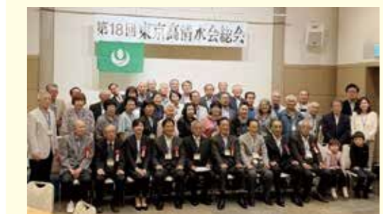
▲6月7日に開催された東京高清水会

夏の訪れと共に、各地区の在京ふるさと会が開催され、私も関東に在住されている市出身の皆さんと交流する機会をいただきました。会場には多くの皆さんが集い、久しぶりの再会を喜び合う声や、ふるさとの話題に花を咲かせる姿が見られ、大変にぎやかで和やかな雰囲気にも包まれていました。 参加された皆さんからは、「栗原の話をする時、当時を思い浮かべ、懐かしい気持ちになります」といった声も聞かれ、栗原への深い愛情を感じたところです。また、栗原の近況や地域の話題に熱心に耳を傾け、多くの皆さんが故郷の発展を気に掛けていることを、大変心強く感じました。ふるさと栗原への温かな思いに触れることができ、人と人とのつながりの大切さを改めて実感