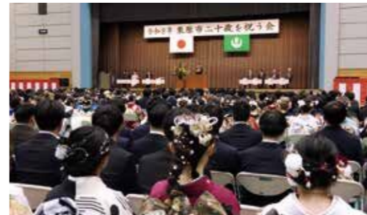
▲前回の式典の様子