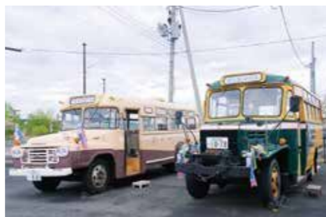
▲運行するレトロなポネットバス

日時 6月14日(日) 午前10時〜午後3時 費用 無料 問 くりはら田園鉄道公園 ☎(24)7961