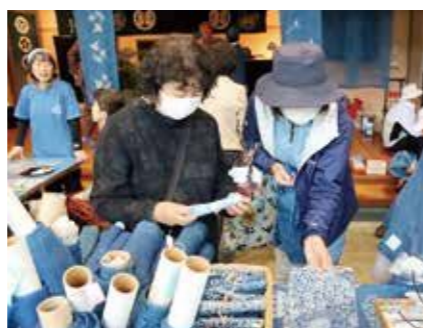
▲昨年の藍フェアの様子