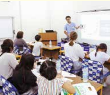
▲親子工場見学ツアーの様子

の企業へもっと興味を持ってもらいたい。ものづくりの生の現場を見てもらいたいとの声を頂いておりました。