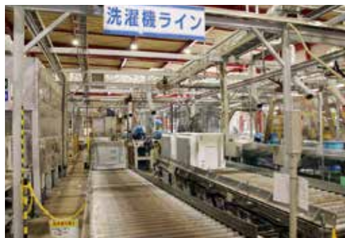
▲作業ラインの様子