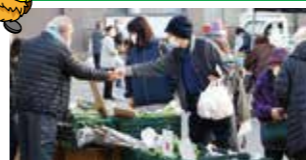
つきだて朝市(3日、17日)