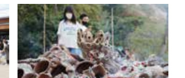
第15回くりはら万葉祭(30日)