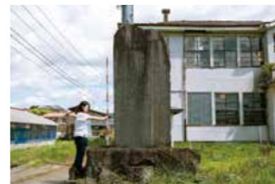
▲栗駒村水害復旧記念の石碑

昨年7月に発生した大雨による水害で、伊豆沼・内沼のハスが冠水したことは、記憶に新しい出来事です。市内における過去の風水害記録を見ると、7月から9月の発生数が多くなっています。栗駒山麓地区と沼倉地区では、1947年から1950年まで、毎年台風によって三迫川が氾濫し、大きな被害を受けました。栗駒村水害復旧記念の石碑には、当時の被害状況が記されています。