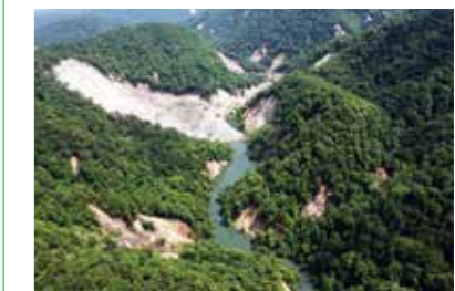
▲土砂によってふさがれた一迫川(2008年)

被害を少しでも軽減するためには、地域の地質・地形や自然災害によって起きる現象を改めて知り、複合的に発生する可能性を考えることが大切です。日ごろから心構えをし、災害に備えましょう。