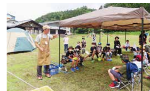
▲デイキャンプイベントの様子