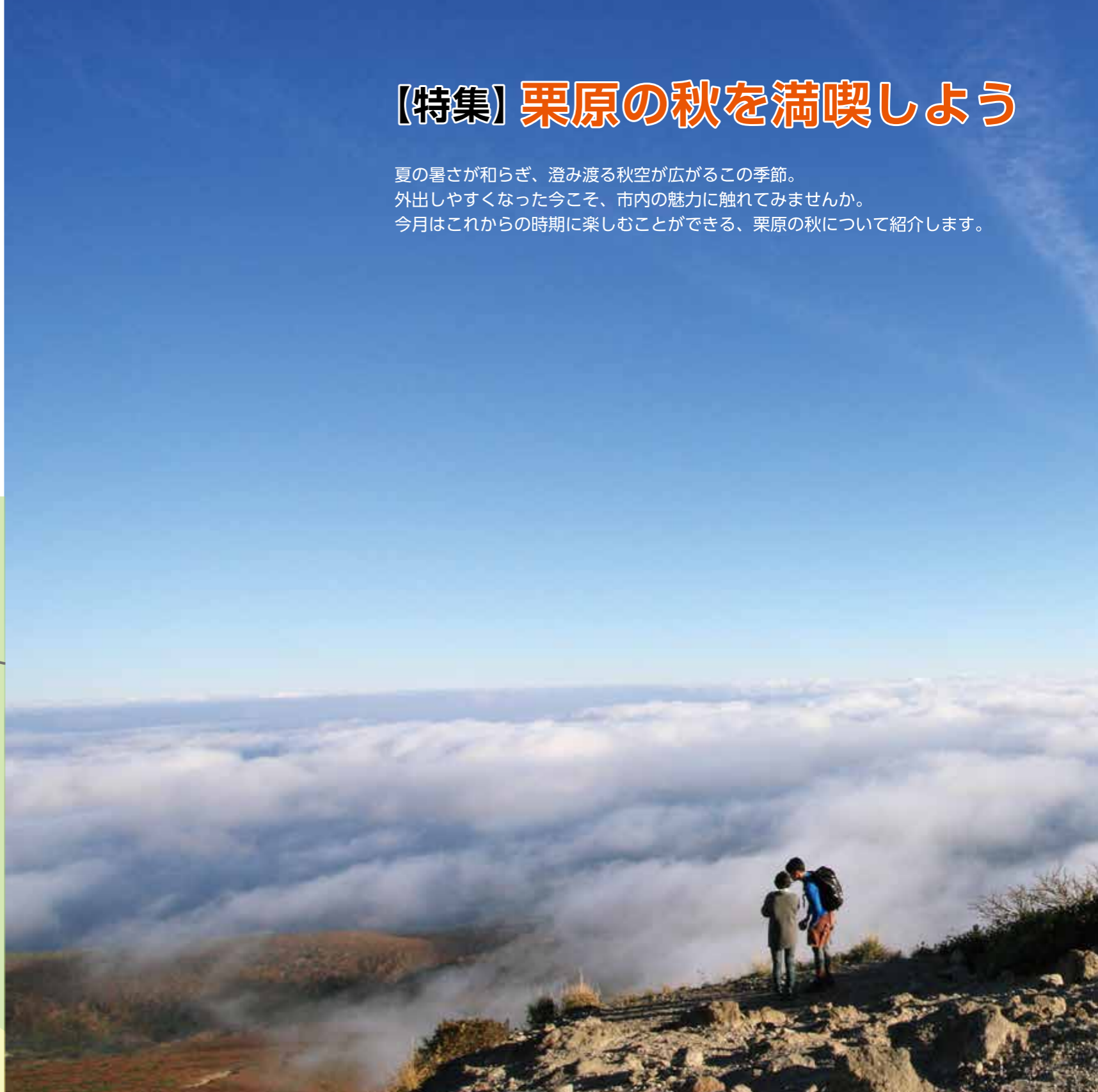
▲栗駒山山頂から望む雲海

栗駒山の紅葉と雲海 東北地方の中央に位置し、宮城・岩手・秋田の三県にまたがる栗駒山。9月下旬ごろになると、山頂付近からドウダンツツジやミネカエデなどの木々が赤や黄に色付き始め、山頂から麓まで紅葉が広がります。 そこにハイマツの緑が加わり、赤や黄の鮮やかさがより際立つその風景は、神の絨毯と称され、毎年全国各地から多くの登山客や観光客が訪れています。 また、この季節の栗駒山の山頂からは、神の絨毯以外にも特別な風景を見ることが出来ます。それは、雲海です。雲よりも高い位置から平野部を見下ろしたときに、見渡す限り雲が海のように一面に広がって見える風景は圧巻です。 雲海が出現する条件には、その日の気温差が大きいことや湿度が高いこと、風がほとんどないことなどがあげられます。 自然現象のため、これらの条件がそろっても必ず見られるわけではありませんが、普段とは一味違う栗駒山の魅力に触れることができるかもしれません。