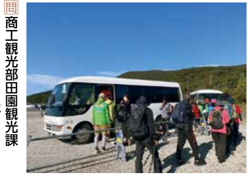
大型バス 1台5千円 ※バス運行時間のみ通行可能