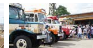
みんなであわせになるまつり(17日)