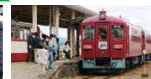
くりでん乗車会(10日)