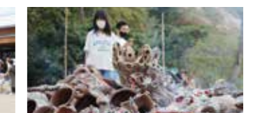
第15回くりはら万葉祭(30日)