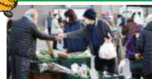
つきだて朝市(3日、17日)