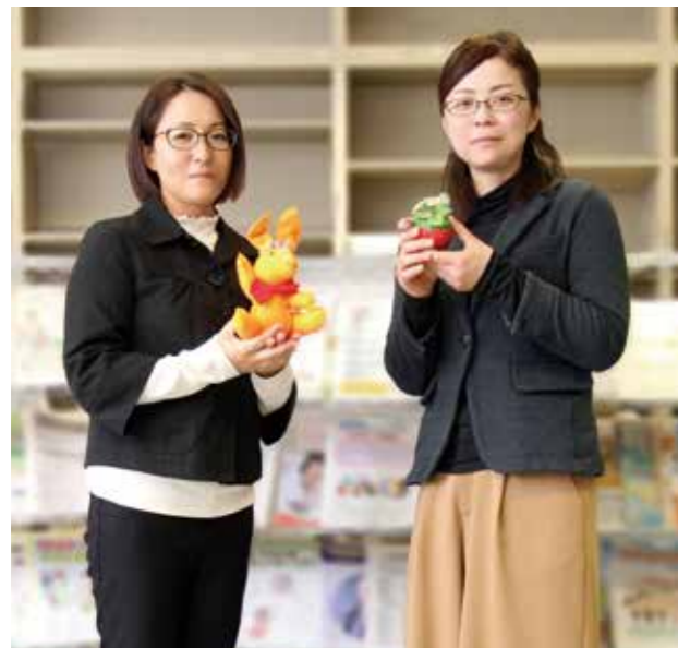
築館・志波姫地域包括支援センター

飲み物を飲みながら、気軽におしゃべりを楽しむことができます。その他にも、認知症について理解を深める活動をしたり、介護に関する悩みを相談し合ったりしています。