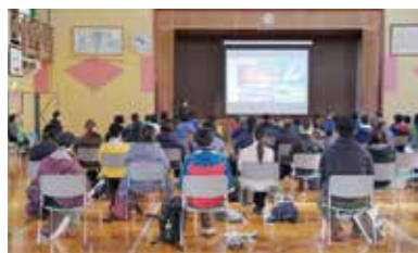
▲全国から集ったジオパーク関係者

また、各日の昼食では栗駒山麓のめぐみを使った弁当でおもてなしを行い、栗原の食文化を味わってもらいました。