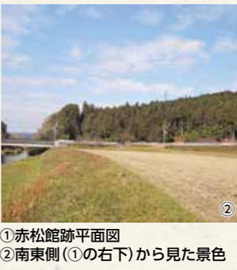
①赤松館跡平面図 ②南東側(①の右下)から見た景色