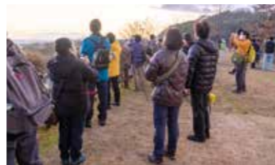
▲伊豆沼・内沼での現地調査

参加した42人は6グループに分かれ、保全に関する研究の蓄積が豊富な伊豆沼・内沼を事例にして、現地調査とグループワークで3日間議論を深めました。その際の視点として、保全されている対象とその価値、対象が面している脅威、保全されることによって生じる恩恵の4点を明確にしました。