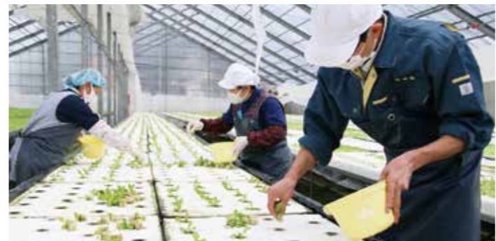
▲サラダ菜の苗植えの様子

葉物野菜は、ビニールハウス内で水耕栽培することで、年間通した生産を実現しています。また、安全・安心な野菜を生産していることを示す国際認証制度を取得するなど、消費者が、おいしい野菜をいつでも安心して食べられるよう、力を入れています。