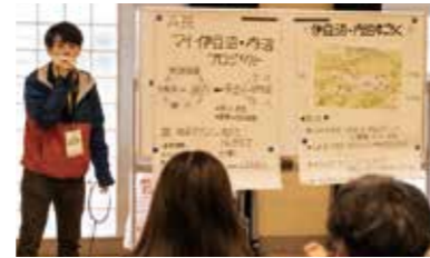
▲3日間の集大成となった模擬コンペ