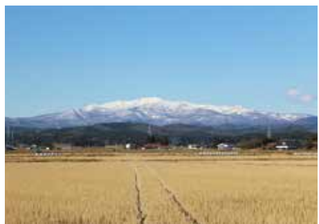
▲栗駒稲屋敷沼田地区から見た栗駒山

栗原には、たくさんの撮影場所があります。それは、ちょっと歴史を感じさせる建物だったり、四季折々の顔を見せる風景だったり、日々の暮らしに降り注ぐ、その地に暮らす人々の笑みであったりです。中でも、市を象徴する栗駒山は、春には残雪、夏には新緑、秋には鮮やかな紅葉の色彩、冬には木々に雪をまとった雪景色と、近くからでも遠くからでも、その姿を市内のあちろちろから眺めることができます。他にも隠れている栗原のおすすめ撮影スポット、自分だけの撮影対象を探して、カメラやスマートフォンを手に、ぜひ、市内を散策してみてください。