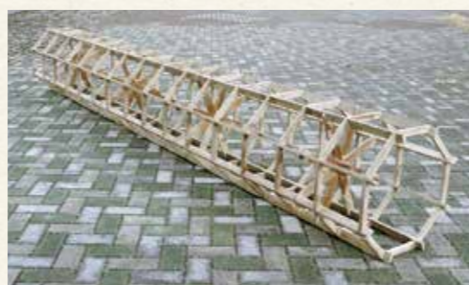
▲16条分を一度に跡付けできるコロバシ

正条植え用具は、大きく二つに分類されます。一つは、用具に付いた目印に合わせて苗を植える目印型、もう一つは、用具で田面に田植えの目安となる跡を付ける跡付け型です。時代が進むにつれ、目印型から跡付け型に移行していきました。