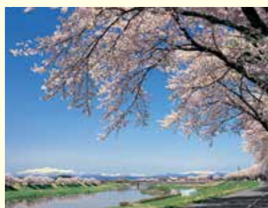
▲新たな気持ちで新年度スタート

今回の改正では、成年年齢が20歳から18歳に引き下げられることにより、携帯電話の契約やクレジットカードの作成など、親の同意が無くても、自分の意思で契