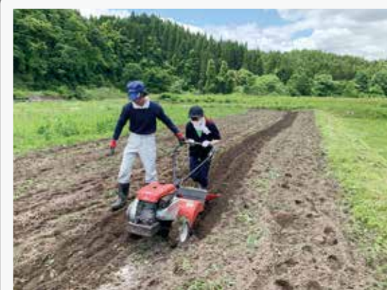
花山でドキドキの初耕運機

なり、夏と秋にも栗駒や花山などを訪ねています。大学では、私はすっかり「栗原の人」になっていて、友達に栗原のことを話したり、栗原で同じ農業体験を通じて知り合った仲間たちと、交流を続けたりしています。