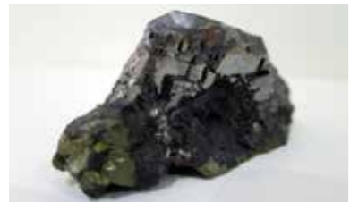
▲製錬すると鉛になる方鉛鉱

地質資源の身近な活用例は、細倉鉱山です。現在は閉山しましたが、最盛期には鉛は国内第2位、亜鉛は第3位の生産量を占め、生産された鉛や亜鉛は、戦前から戦後における日本の経