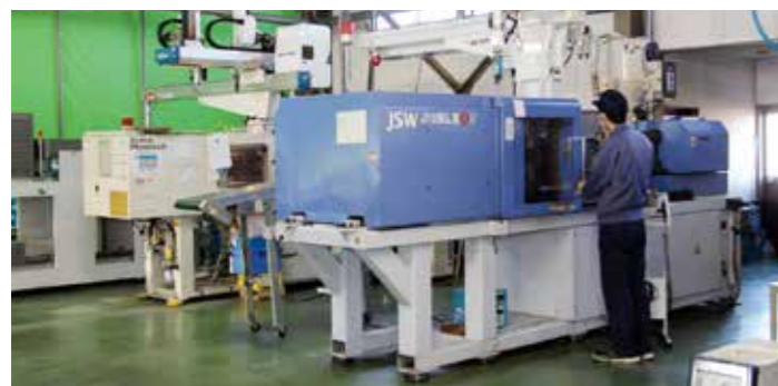
▲プラスチック成形加工機

金型の設計・製作から、製品の量産加工・出荷までを自社で行っているため、顧客それぞれのニーズに応じた製品を迅速に作るすることができます。また、社内で一貫した製造ラインを持っているため、即時に製品の改善を行えることが強みの、技術力の高い会社です。