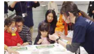
▲転石を活用した岩石標本づくりの様子

栗駒山麓ジオパークでは、地質・地形遺産の価値を広く伝え、保全と資源の賢明な利用の促進へ向けた活動に取り組んでいます。私たちの豊かな暮らしの背景にある、多様な国際問題や地域課題に目を向けてもらえるような教育活動などを、今後も継続していききたいと思います。