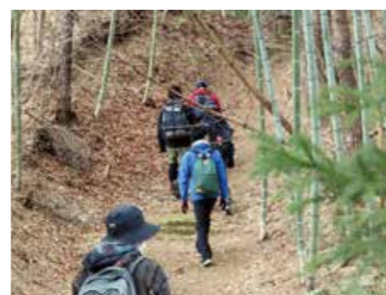
▲トレイルイベントの様子