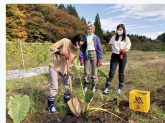
花山の大量収穫にチャレンジ!