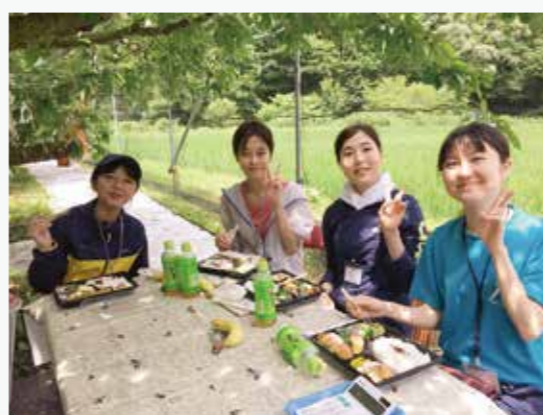
栗駒の自然と仲間と囲まれて、食べるお弁当サイコー♪

また、県外から来た私が、栗原の人たちに受け入れてもらえるのか心配していましたが、皆さん快く受け入れてくれて、とても安心しました。栗原は、いつ帰っても受け入れてくれる実家のような安心感があり、それが魅力だと感じています。