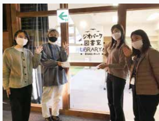
ジオパーク図書室 開設準備のお手伝い