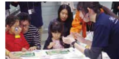
▲地質資源の希少性を伝える岩石標本作り

ジオパーク活動そのものが、国連が求める「持続可能な社会」の実現へ向けた重要な役割を担っているのです。