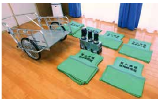
▲助成で整備した防災備品