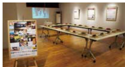
▲昨年度の長屋門ステイProject企画展