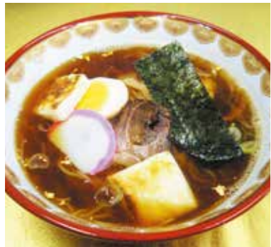
▲餅と金箔の縁起の良い延年ラーメン

金成地区に縁のある「金」と「餅」を使い、一番人気の商品であるラーメンと組み合わせることを決意。餅のおいしさをより一層引き立たせるスープは何かと試行錯誤した結果、鶏ガラと煮干しでだしを取った醤油ラーメンにたどり着きました。