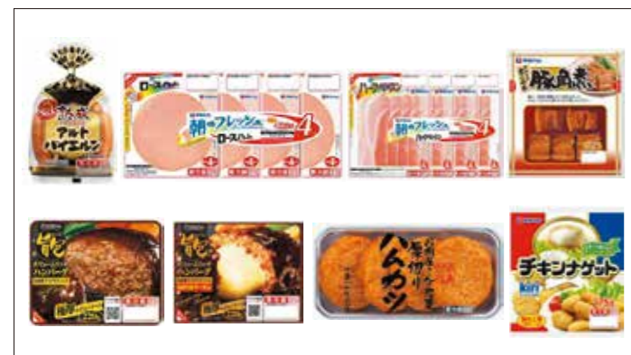
▲製造している主な商品

従業員のおいしさを求める研究心と伝承された味を大切にしながら、衛生管理を徹底するためHACCPシステムを全国に先駆け導入し、安全でおいしい食を全国のご家庭に提供しています。