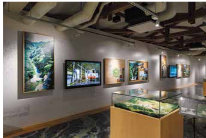
▲栗駒山麓ジオパークの魅力を楽しく学べる展示室

●場所 栗駒山麓ジオパークビジターセンター 栗駒松倉東貴船5番地(旧栗駒小学校)