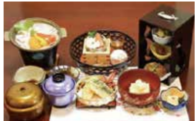
▲栗原の食材のみを使用した迫野御膳