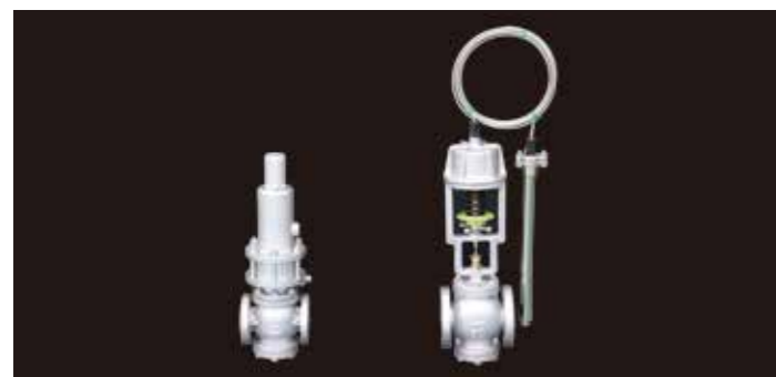
▲液体用圧力調整弁と自動温度調整弁

製造しているバルブで代表的なものは自動調整弁で、住宅設備や各種プラント設備、船舶設備などで使用されるバルブを製造しています。中でも自動温度調整バルブは、国内需要の大半を製造しています。多様化する顧客ニーズに応えるため、新しい技術開発にも取り組んでいます。