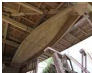
▲洪水災害時に使用した舟