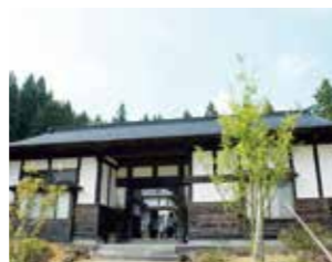
▲栗駒文字地区の長屋門

長屋門を通じて栗原の景観をひも解くと、農村の歴史や自然災害への備えなど、地域の暮らしが見えてきます。