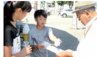
▲一生懸命に魅力を伝える児童