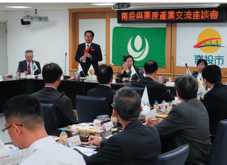
▲南投市での意見交換会の様子