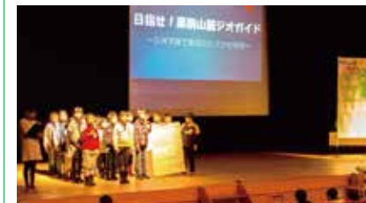
▲昨年度の学習交流会

□発表校 築館小学校6年生 鶯沢小学校5・6年生 金成小学校6年生 瀬峰中学校2年生