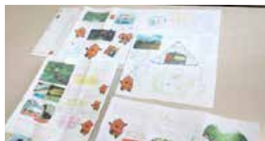
▲栗原の魅力が詰まったリーフレット

今年度は、8月27日と28日に荒砥沢地すべりなどの崩落地と伊豆沼・内沼でフィールド学習を行いました。児童は、事前学習で出た疑問をジオガイドに尋ねたり、栗原の魅力である美しい景色を撮影しました。その後、ジオ学習で得た栗原の情報と魅力が詰まったリーフレットを作成しました。