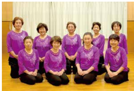
▲上野教室の皆さん