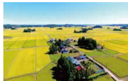
▲家屋の北側と西側にあるイグネ

藩政時代から受け継がれてきたイグネは、地域の暮らしの知恵が詰まった、美しく価値のある景観と言えるでしょう。