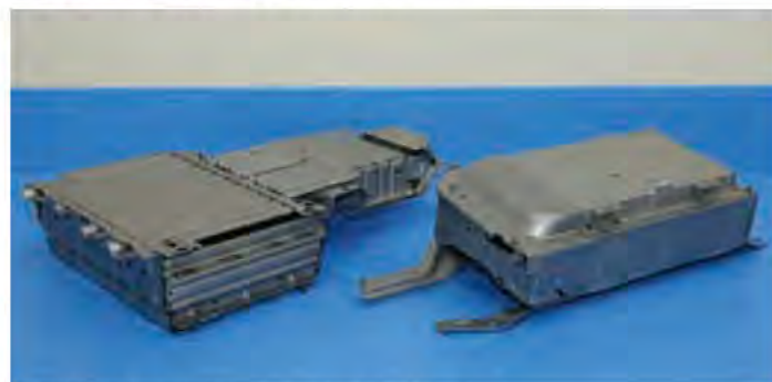
▲製造されたハイブリッド車用のバッテリーケース

自動車の燃費向上が求められる中、従来使われていた鉄よりも軽く強度のあるハイテン材やアルミニウム材などを高い技術を生かして加工することで、安全性の確保と軽量化の両立に取り組んでいます。