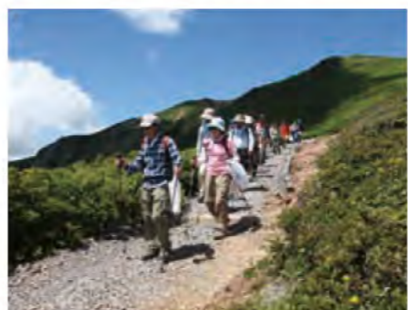
中央コースでの清掃登山

だと思い、そのごみ箱を撤去し、ごみは家まで持って帰ることを徹底して呼び掛けを継続しました。時がたつにつれて、活動が浸透して、ごみはほとんど落ちていない栗駒山に戻りました。まさに継続は力なりです。 このほか、宮城県に依頼により、山頂付近の裸地化した斜面や内陸地震で崩壊した場所に高山植物を移植したり、ミネヤナギの苗木を植樹するなど、回復活動を実施しています。また、世界谷地原生花園の一部区域で、乾燥化が進み、ヨシやササ、灌木類が生育するなど植生の変化が見られたため、ヨシ刈りも実施しています。今後も保全活動を継続し、変わらぬ姿の栗駒山を残したいと思っています。