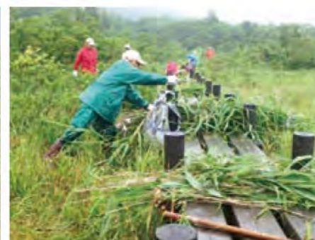
世界谷地原生花園のヨシ刈り