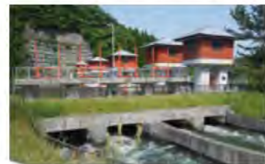
▲現在の伊豆野堰(手前が取水口)

水路の測量には、北上川改修工事で手腕を発揮した、川村孫兵衛元吉があたりました。取水地から伊豆野原までの高低差がわずか13メートルしかない中、孫兵衛は夜の間にちょうちんの灯りを頼りとして、土地の高低差を見極めたと伝えられています。およそ3年の歳月をかけて完成した伊豆野堰は、当初、水が流れなかったものの、水路の途中に滝を設けるなどの改良を行い、無事に下流までの通水に