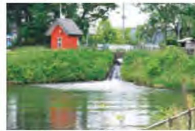
▲志波姫堀口の大滝