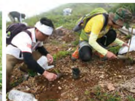
ミネヤナギの保全植樹