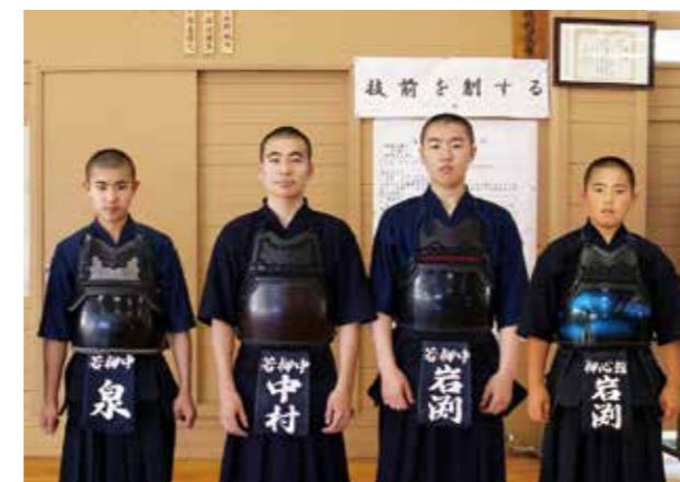
若柳剣道スポーツ少年団、廣心館道場、吉成剣友会の各選手