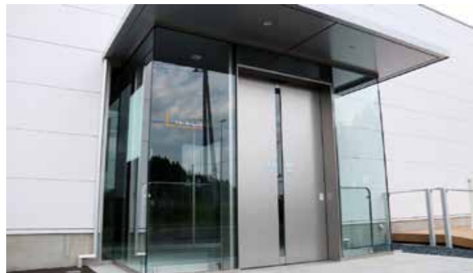
生産される金属製自動ドアサッシなど

ナブコト株式会社(旧エヌ・エス・ト株式会社)は、自動ドア販売大手のナブコシステム株式会社のグループ会社として築館地区で操業を開始し、今年で16年になります。建物の顔となるエントランス(玄関)で使われる金属サッシなどを生産し、その精度や加工技術の高さから、デザイン性の高い建物にも多数使用されています。また、今年3月には築館インター工業団地に新社屋も完成し、東京五輪関連の需要に対応できる体制を整えました。