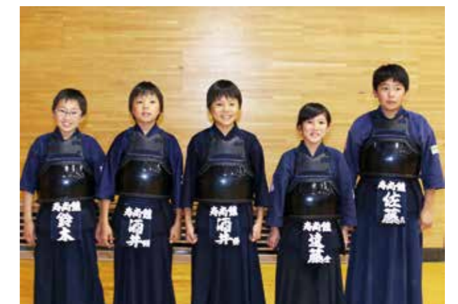
寿尚館大ヶ原道場の各選手