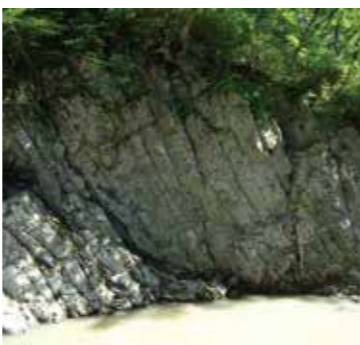
▲四巻の滝周辺では、柱状に割れた岩石が露出