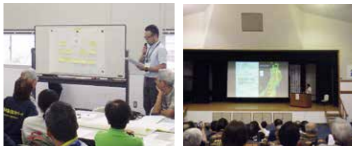
▲昨年開催された東北ジオパークフォーラムin八峰白神の様子