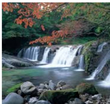
▲火山灰でできた岩石を貫いた硬い溶岩が不動の滝を形成

また、この溪谷がある一迫川は、およそ2万年前に現在よりも40メートル高いところを流れていましたが、河川の浸食によって川底が削られ、現在の高さを流れるようになりました。