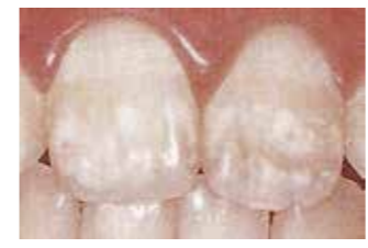
▲永久歯の形成不全

乳歯が生えるのは生後6〜7カ月ころで、まず下の前歯からですが、乳歯の歯胚(歯のもとになる組織)はお母さんのおなかの中に赤ちゃんがいる時期からでき始めています。しかも、お母さん自身が妊娠しているから歯胚はでき始め、静かに少しずつ時間をかけて歯冠から歯根へと石灰化は進みます。歯冠ができあがるのは出産後、萌出の数カ月前です。こうした形成中の乳歯は、全身的な変調や障害に対して身体中で最も敏感に反応するので、なんらかの原因で一時的にせよ歯の形成がうまくいかないと、すべての乳歯のその時の石灰化部分に、できそこないができてしまいます。そして、歯は一度できそうとなると永久に形が変わりません。 Q1 歯の形成をさまたげる原因とは何ですか? A1 つわりがひどくて食べ物をろくに食べられず、ひどい栄養障害があったり、あるいは母親が重い病気にかかった場合などです。また未熟児で生まれた場合も乳歯は弱いといわれます。 Q2 永久歯についても妊娠中の管理が大切ですか? A2 妊娠中に石灰化する乳歯だけでなく、妊娠中の栄養によって歯が丈夫になるとよく言われてきましたが、これは乳歯だけの話で、永久歯とは関係ありません。永久歯の石灰化が始まるのは出生後からであり、歯冠ができあがるのは、最も早い六歳臼歯で2.5〜3歳、最後の十二歳臼歯で7〜8歳です。したがって、たとえ乳歯に形成不全が見られても、子どもが8歳ころまで健康で永久歯の形成が妨げられなければ、きれいな永久歯が作られます。しかし、重い病気にかかった場合などには、すべての永久歯のその時期の石灰化部分に形成不全が現れるのは、乳歯の場合と同じです。