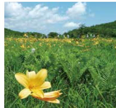
▲ニッコウキスゲの群生