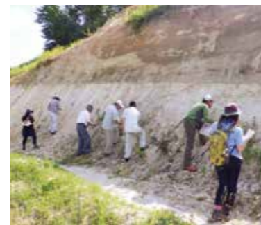
▲平成28年度の講座の様子