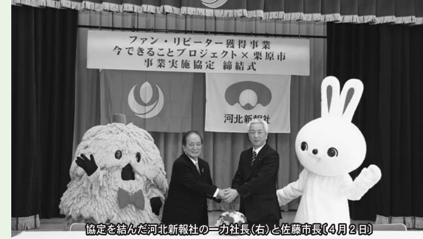
協定を結んだ河北新報社の一社社長(右)と佐藤市長(4月2日)