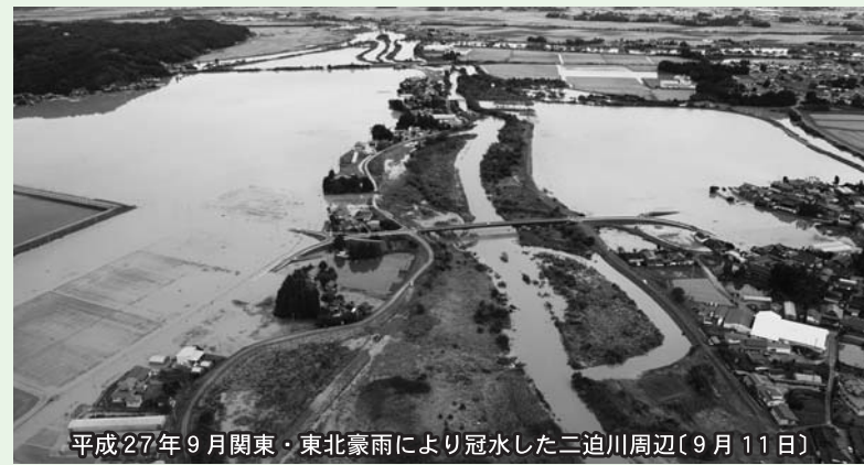
平成27年9月関東・東北豪雨により冠水した二迫川周辺(9月11日)