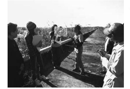
▲10月のジオツアーで伊豆沼のガイドをする様子