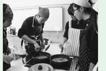
▲米粉ピザの調理実習

を発酵させる工程で「パンのようなにおいだ」、「ふわふわだ」などの感想があり、ピザに乗せるトッピングは地域で採れたハウレンソウやパプリカを使いました。これからも生徒が食と地域に興味や関心を持てるような実習を行っていきたいと思います。