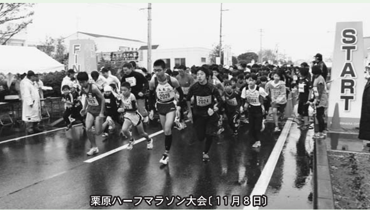
栗原ハーフマラソン大会(11月8日)