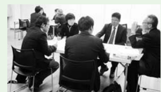
▲幼稚園主任・学年主任研究会の様子

主学習です。すべての小・中学校で、学年に応じた家庭での勉強の仕方のプリントや冊子を配布しており、自主学習の比率は学年が上がるにつれて大きくなるようになっていきます。小学生は「学年×10分」、中学生は「学年×60分」以上を目標に家庭学習に取り組むよう勧められています。 宮城教育大学留学生との国際交流事業 11月25日(水)、瀬峰小学校と清水小学校で、宮城教育大学との連携事業である「留学生との交流会」を開催しました。留学生から母国の話を聞いたり、一緒にゲームを楽しんだりしながら、お互いの文化の違いや共通点を見つけて、外国への興味・関心を高めました。