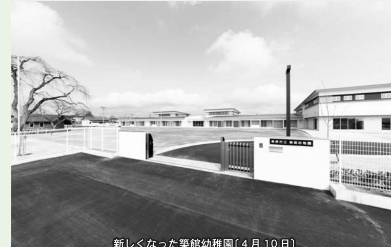
新しくなった築館幼稚園(4月10日)