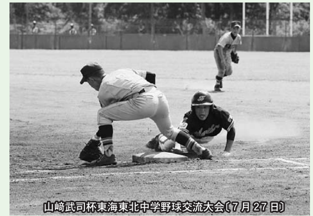
山崎武司杯東海東北中学野球交流大会(7月27日)