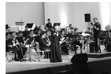
▲迫力ある演奏が観客を魅了

合併10周年を記念して、海上自衛隊横須賀音楽隊のコンサートを開催しました。音楽隊はジャズやクラシック、アニメのテーマ曲などの楽曲を演奏し観客を魅了しました。また、市合唱連盟との市民歌の合唱も行われ、盛んな拍手が送られました。