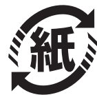
▲資源ごみとして出せる紙製容器包装マーク