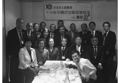
▲参加者全員で記念写真

栗原に住んでいたころの思い出や、栗駒山への想い、くりはら輝かせ隊としての活動についてなどを話していただきました。