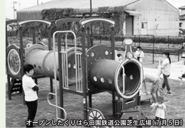
オープンしたくりはら田園鉄道公園芝生広場(7月5日)