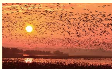
▲朝日を背に一斉に飛び立つガンの群れ

※早朝は、鳥たちがまだ眠っていますので、車のライトやカメラのフラッシュを沼に向けることはやめ、マナーを守り観察してください