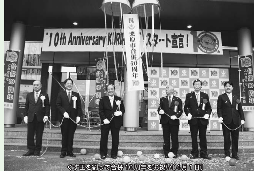
くす玉を割って合併10周年をお祝い(4月1日)