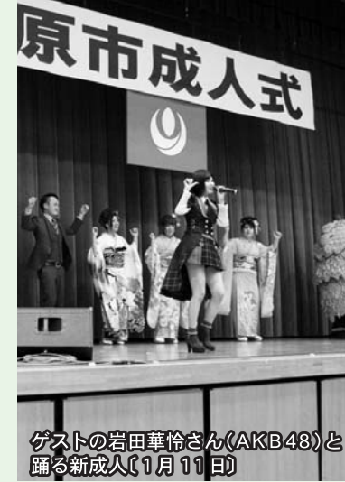
ゲストの岩田華怜さん(AKB48)と踊る新成人(1月11日)