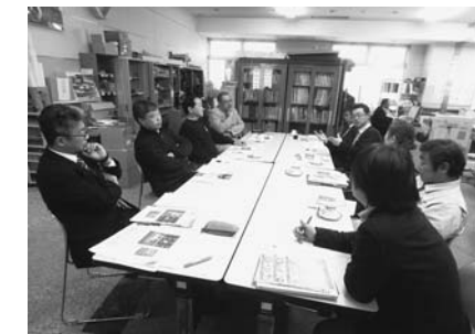
▲ジオパーク関連商品を検討しています

栗原市を訪れる方のツアーコースやお土産、食事など、ジオパークに関連した商品開発を検討しています。現在の取り組みの一つとして、地元食材をふんだんに使ったジオパーク弁当や和菓子などが挙げられますが、既存のお土産や工芸品ともタイア