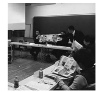
▲読本のイメージについて意見交換をする様子

栗原市の地形・地質や、過去に起きた震災・水害などを後世に伝えるため、分かりやすく、親しみやすい小冊子づくりを担当しています。市教育委員会や学校教諭などによるグループでは、児童・生徒