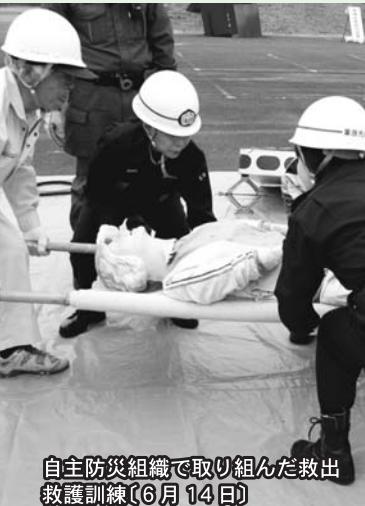
自主防災組織で取り組んだ救出救護訓練(6月14日)

14日(日) くりでん乗車会を開催(11月までの毎月第2日曜日開催) 14日(日) 平成27年度栗原市総合防災訓練「サン・スポーツランド栗駒」