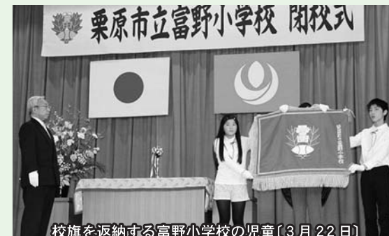
校旗を返納する富野小学校の児童(3月22日)