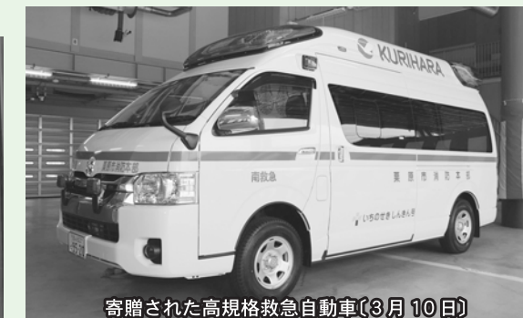
寄贈された高規格救急自動車(3月10日)