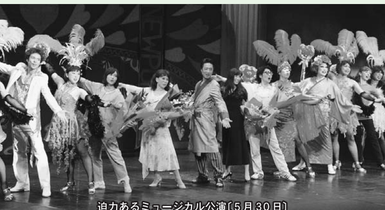
迫力あるミュージカル公演(5月30日)

合併10周年を迎えた平成27年。4月1日の合併10周年オープニングセレモニーから始まり、「これからもずっと…栗原」をキャッチフレーズに、さまざまな記念事業に取り組んだ年でした。平成27年から取り組んできた「栗駒山麓ジオパーク構想」の活動が認められ、日本ジオパークに認定されました。また、4月に日本陸連公認となったハーフマラソンコースを会場に開催した「第1回栗原ハーフマラソン大会」では、全国からたくさんの方が参加し、颯爽と駆けぬけました。栗原の魅力为全国へ発信するなど、さまざまな施策に取り組んだ平成27年を振り返ります。