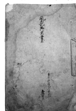
▲川口村風土記御用書出

風土記御用書出、または風土記御用書上とは、仙台藩が安永年間(1772～1781)に各村や知行地(江戸時代、大名が家臣に与えた土地)単位で作成させたもので、「安永風土記」とも呼ばれています。1773(安永2)年から1780(安永9)年まで8年かけて作成され、大川口村のものは1778(安永7)年に完成しました。これらはほぼ統一された調査項目で構成されています。