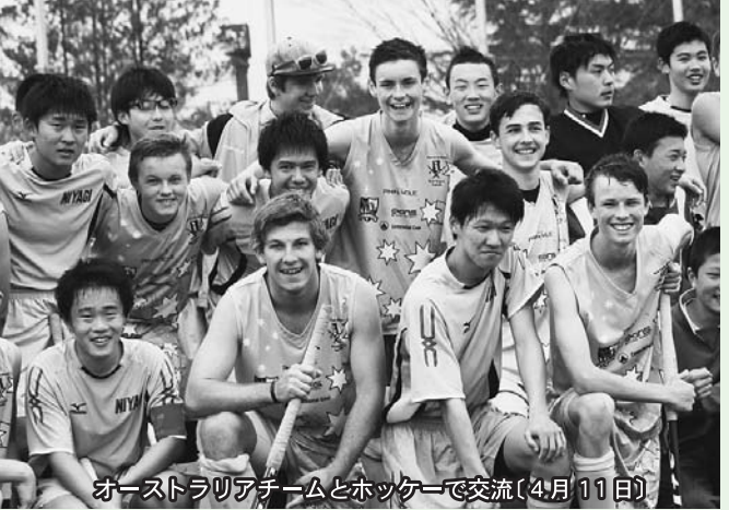
オーストラリアチームとホッケーで交流(4月11日)