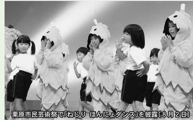
栗原市民芸術祭で「ねじりほんによダンス」を披露(8月2日)