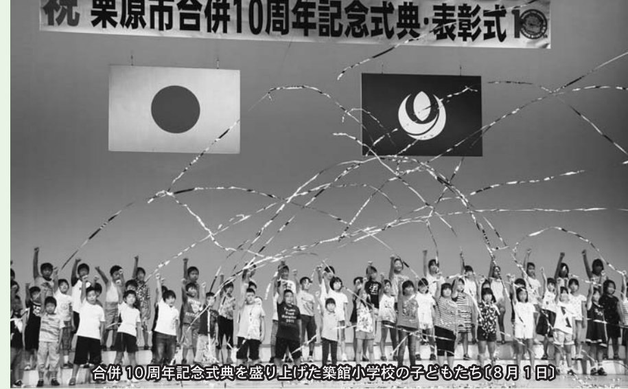
合併10周年記念式典を盛り上げた築館小学校の子どもたち(8月1日)