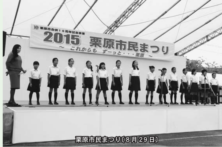
栗原市民まつり(8月29日)