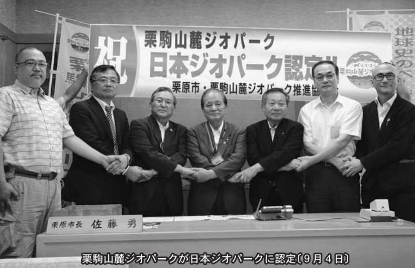
栗駒山麓ジオパークが日本ジオパークに認定(9月4日)