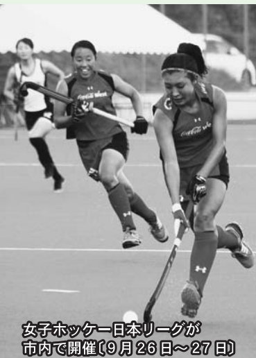
女子ホッケー日本リーグが市内で開催(9月26日~27日)

13日(日) 第8回宮城県指定廃棄物処理促進市町村長会議が開催され、栗原市長が最終処分場候補地の返上を表明 13日(日) 一般国道4号築館バイパス、市道栗原中央線が部分開通「志波姫地区」 12日(土) 脳科学者の茂木健一郎氏を講師に栗原市合併10周年記念「心にきざむ文化講演会」を開催「栗原文化会館」