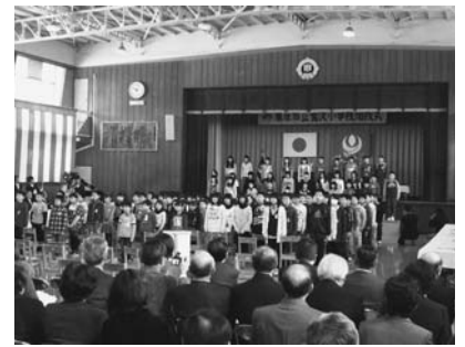
▲ 昨年の鶯沢小学校閉校式の様子 (児童による合唱)