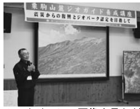
▲スクリーンの画像を見ながらガイド実践する受講者

ジオガイドとして活躍していくためには実践は欠かせません。ほかの受講者を観光客に見立て、栗駒山、長屋門、岩手・宮城内陸地震のいずれかをテーマに、市で準備したシナリオを独自の視点でアレンジしながら、1人5分の持ち時間でガイドの実践を行いました。