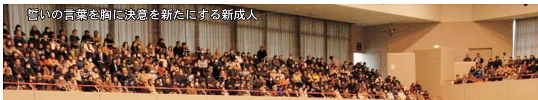
誓いの言葉を胸に決意を新たに新成人