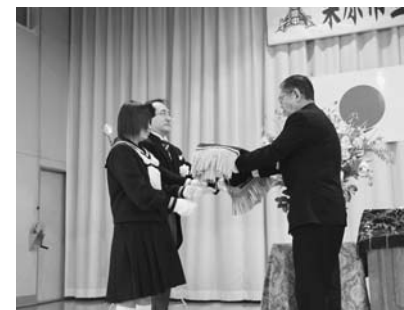
▲ 昨年の一迫中学校閉校式の様子 (生徒代表と学校長による校旗返納)