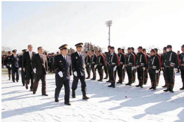
▲市長などによる観閲の様子

市消防団員と消防職員約860人が参加し、恒例の出初式を行いました。出初式では、市長が「消防職団員の強い団結力と旺盛な士気のもと、今年も不屈の消防精神を十分に発揮し、意気果敢に活動されることを切望します」とあいさつしました。また、消防長と消防団長から「消防職団員には、市民の安全、地域の安全確保のため一層の努力をお願いしたい」などの訓示がありました。出初式終了後には、無火災を願い、消防車両23台による祝賀放水も行われました。