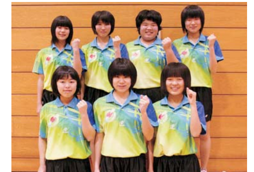
若柳中学校女子卓球部