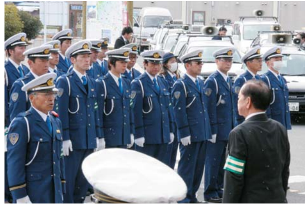
▲小雪が舞う中で行われた出動式

日ごろから街頭指導など、地域の安全確保に尽力している交通安全指導員の、新年の出動式を行いました。出動式には、81人の指導員が参加し、市長が「市内の交通事故件数は減少していないため、関係機関などと連携し、全市一丸となって交通事故撲滅に取り組むとともに、指導員の皆さんには、地域活動の中心となって活躍されることを期待します」とあいさつしました。指導員の皆さんは心新たに、交通事故の撲滅に向けて取り組もうと気を引き締めていました。