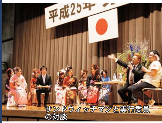
サンドウィッチマンと実行委員の対談

また、講演の中で成人式実行委員との対談も行われ、人生の先輩であるサンドウィッチマンの二人に、さまざまな質問をしていました。お二人は、新成人に対して「これからは皆さんの時代になっていくので、復興に向