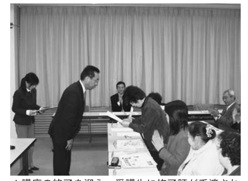
▲講座の終了を迎え、受講生に修了証が手渡されました

これからも、受講生の皆さんが学習したことを実践し、地域で活躍することを期待しています。男女共同参画社会の実現のためには、市民の皆さん一人一人が「自分ができることから始めよう」と考え、実践することが大切です。誰もが平等で生き生きと暮らすことができる社会の実現を目指して、日ごろの生活を、少しでも良いので見直してみませんか。きっと、「自分ができる男女共同参画」が見つかるはずです。