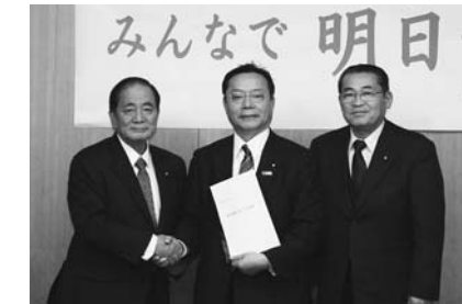
▲谷復興副大臣へ要望書を提出

□農林畜産物や浄水発生土、下水汚泥処理などの損害の全額補償と早期支払いについて □食の安全安心の確保のための放射性物質にかかる測定経費などの全額負担について 企画部企画課 ☎(22)1125