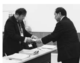
▲市長から受講者一人一人に修了証書が手渡されました

ガイドとして活躍するための安全管理や、活動におけるリスクマネジメントなどの基本的な考え方についての講話をいただきました。 ●危険予知と対策の徹底が大切で、事前に下見したり、対象者の情報を集めたりして、どんな事故やけがが起