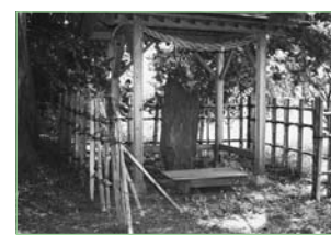
▲中央にまつられている二本石

高清水の市街地の北側には影の沢と呼ばれる丘陵があります。丘陵の頂上には、高さ1・4m、一辺9mの塚があり、その中央に二本石と呼ばれる板碑(中世の供養碑)が1基あります。江戸時代にかかれた「高清水拾遺志」によると、2基の板碑があり、1776(安永5)年には板碑の後から壺が出土し、埋め戻されたこと記されています。近年、塚の頂上部で中世陶器の破片が発見されています。板碑は、1334(元弘4)年に「弥次郎入道」と「弥次郎入道」が主催し「六十六部接待供養」を行うために建立されたものです。これは法華経を写経し霊場に奉納したという風習を伝えるものです。この丘陵は折木山とも呼ばれ、影の沢の西側には来光沢という地名があります。「高清水拾遺志」には「御堂(高清水善光寺)之背嶺二登り丑ノ方ヲ顧八谷ヲ隔テ折木山翠嶺ノ雲ヲ挟ム、昔ヨリ此山頂ニ紫雲巖キ弥陀ノ三尊影向シ給フ故来迎沢ト号ス」と記されており、この丘陵が中世から近世にかけての高清水地区にとって宗教的に重要であり、信仰の対象であったことが分かります。なお、この地は私有地内ですので見学はできません。