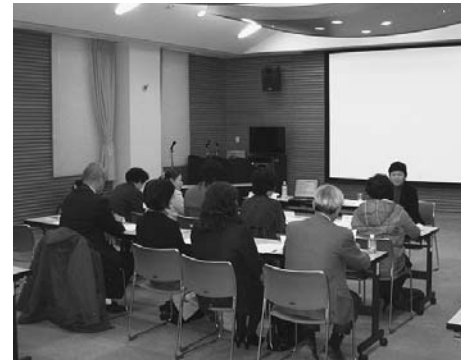
▲第7回の講座の様子

講座では、「防災分野にも女性の視点が必要」と強く訴えるとともに、「地域を守る、大切な人を守るためには、平時から防災の取り組みをしなければならぬ。例えば、防災訓練にはさまざまな立場の人が参加できるようにし、その地域にどのような人が暮らしているか、災害時にどんなことに困るのかを知っておくことが大切だ」と話していました。