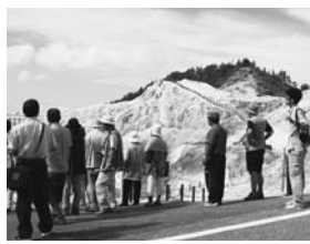
▲湯沢市ジオサイト「川原毛地獄」を視察

ジオパークを目指している地域のジオサイトがどうあるかを知るため、湯沢市のジオサイトを視察し、ジオガイドとして活躍している方から心構えを学びました。 ●ジオガイドはジオの魅力や来訪者に伝える語り部です。ジオパークを魅力的なものにするには、地域の良さを知り、それを自分の言葉で来訪者に伝えることが重要です。