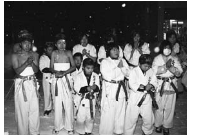
▲家内安全を願い、みんなで一本締め

小雪が降る中、25回目を迎える「せみね裸参り」が行われました。子どもから大人まで約80人が参加し、約2kmの道のりを1年間の無病息災を願い、太鼓や鐘を鳴らしながら練り歩きました。途中では、家々を回り家内安全を願って一本締めを行い、最後に神社で願いが成就するよう祈願していました。