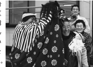
▲獅子に頭をかんでもらう地区住民

「金田郷土芸能新春初舞大会」が行われ、八ッ鹿踊りや川北神楽、川口ばやしなどが、「この1年が良い年でありますように」と願いながら商店街を練り歩きました。沿道で出迎えた地区の方々、獅子舞の獅子に頭をかんでもらい、厄払いと家内安全などを祈願していました。