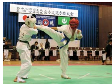
▲全力で戦う選手たち

大会は、秋田県や神奈川県など県内外の幼児から大人まで約192人が参加し、各部門ごとに試合が行われました。選手たちは、日頃の練習の成果を果敢に発揮し、全力で戦っていました。