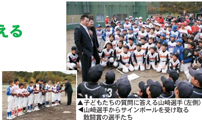
▲子どもたちの質問に答える山崎選手(左側) ▲山崎選手からサインボールを受け取る 敢闘賞の選手たち

試合の後には、山崎選手への質問コーナーもあり、子どもたちからのさまざまな質問に山崎選手は、時折答えに困るような場面もありましたが、一つ一つ