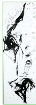
毎日賞に輝いた作品『Moon Bow』

※輝く日本一くりはら大賞は、市民が各分野において、日本一またはそれに準じる成績を収め、広く市民に希望と勇気を与えた個人や団体に対して贈るものです