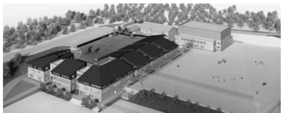
▲(仮称)金成小中一貫校の完成イメージ