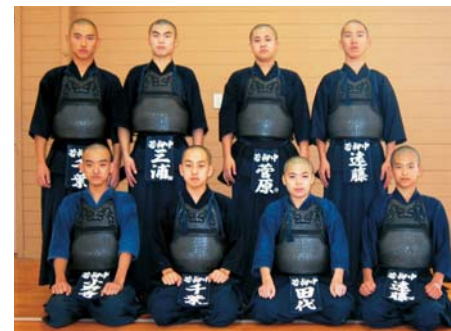
若柳中学校男子剣道部