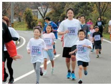
▲コースを駆け抜ける参加者たち