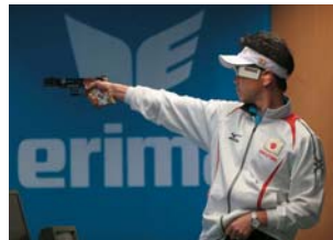
▲秋山選手の射撃の様子

内で、各5発速射する競技です。これを2日間で4回繰り返し、計60発600満点で上位6人が決勝に進む条件の中、秋山選手は584点、48人中6位で予選を通過しました。4秒の速射での中心部に当たった数を競う決勝では、8回40発の射撃で、世界タイ記録となる34発を命中させ、日本人で初めての金メダルに輝きました。