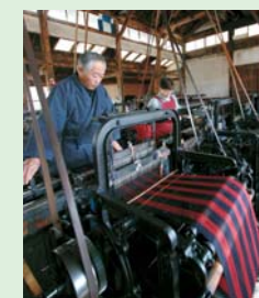
▲千葉孝機業場の織機

産されています。約100年前の織機が今もなお生産し続け、現役で働く姿にトヨタ自動車の役員が感動して、「ぜひ、記念品に」とお願いされたと聞きました。