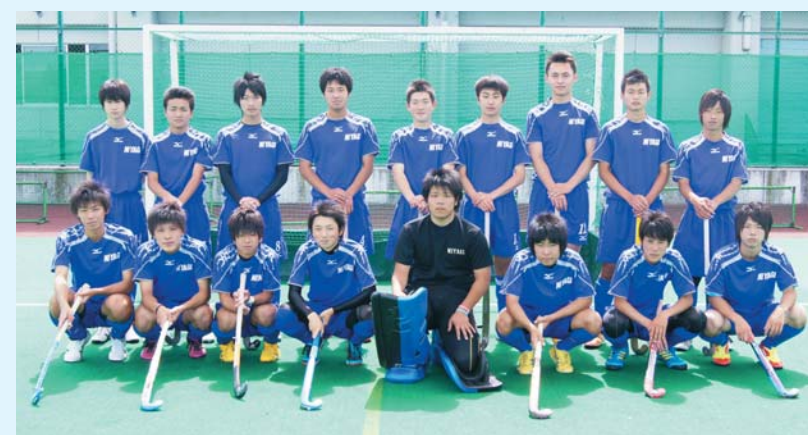
築館高等学校男子ホッケー部