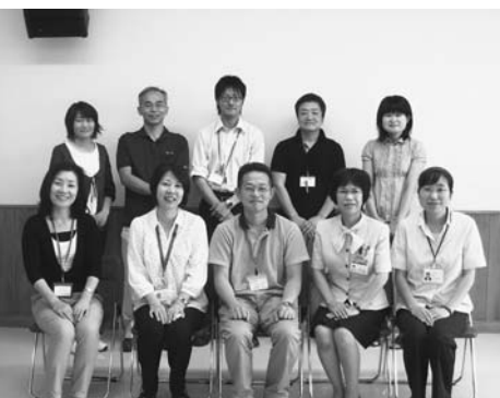
▲講師となる認知症キャラバン・メイトの方々

認知症を正しく理解し、認知症の人や家族を温かく見守る応援者の方をサポーターと呼んでいます。何か特別なことを行う、というのではなく、友人や家族に認知症の正しい知識を伝え、認知症になった人や家族の気持ちを理解するように努めるなど、地域で暮らす人として自分のできる範囲で活動する方々です。