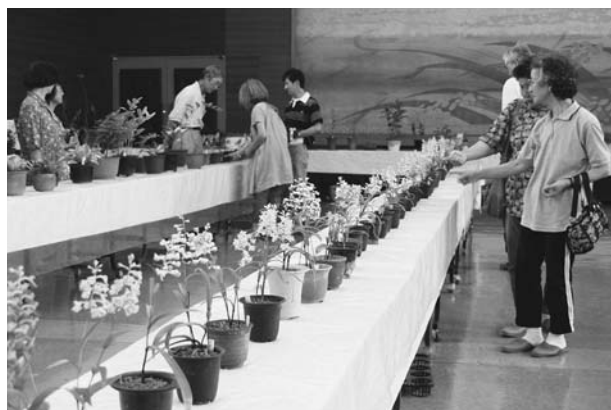
▲会場いっぱいにウチョウランなどを展示

来場者は、色鮮やかで、愛らしくも力強く咲く花々の出来栄に関心し、栽培・管理方法を展示者から熱心に教わるなど、夏の花展を満喫していました。