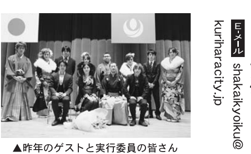
▲昨年のゲストと実行委員の皆さん