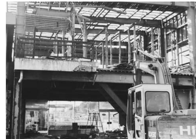
▲支援制度で被災した倉庫を解体した例

※肥料原料として利用する下水汚泥の基準は、放射性セシウム200ベクレル/kg以下です