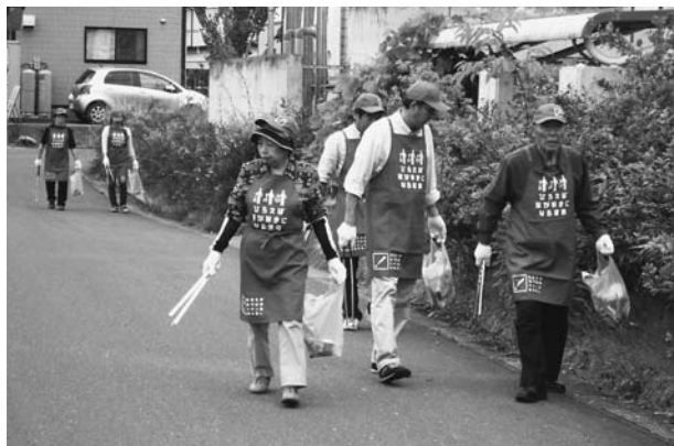
▲築館たばこ販売協同組合若柳支部による清掃活動の様子