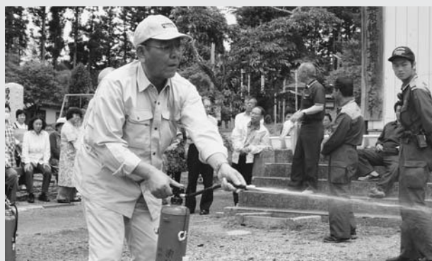
▲初期消火訓練の様子