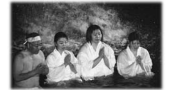
▲昨年の寒中みそぎの様子

1月15日(日)午後7時～ 小僧水神社不動の滝(一迫) ▷内容 家内安全・無病息災・厄払い・五穀豊穡・合格祈願のみそぎ ※どんと祭も同時開催 ☎ 小僧不動の滝寒中みそぎ実行委員会 ☎(52)4311