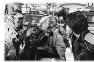
▲昨年の初舞大会の様子

1月2日(月)午前10時～正午 一迫金田地区商店街 ▷内容 ハッ鹿踊り、川口ばやし、川北神楽などのパレード ☎ 金田郷土芸能連絡会 ☎(54)2111