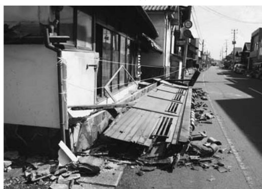
▼震災で塀が倒壊(若柳地区)