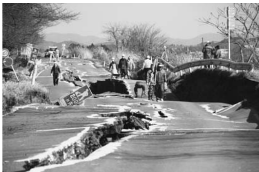
▲東日本大震災で被災を受けた市道(3月12日)