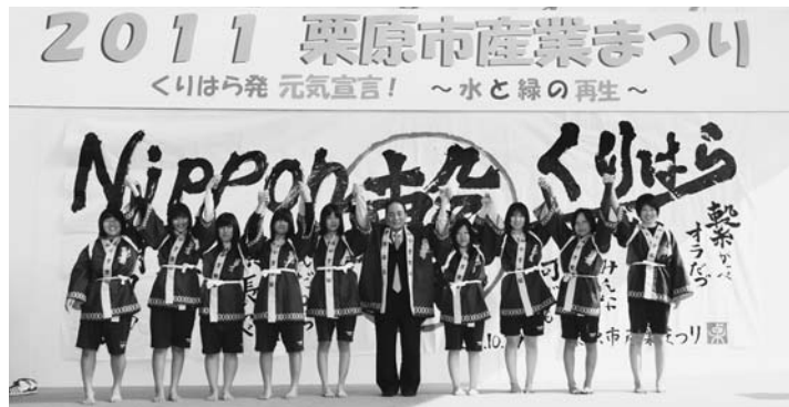
▲全国各地からの支援に、感謝を込め開催した「2011 栗原市産業まつり」(10月29日・30日)

1日(木) 荒砥沢ダム崩落地安全対策モニタリング事業に監視モニター公開 20日(火) 学校再編に基づく再編後の校名を決定 【鶯沢幼稚園】 文字幼稚園・鶯沢幼稚園 22日(木) 市道馬場駒の湯線「冷沢橋」が開通し、岩手・宮城内陸地震での被災路線がすべて復旧