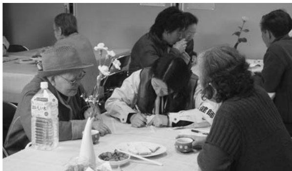
▲南三陸町からの避難者の受け入れ(4月3日)