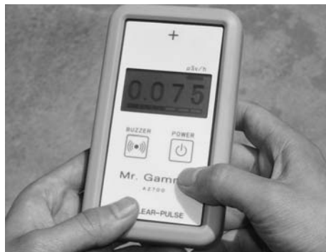
▲市内5カ所の消防施設で、空中放射線量の測定を開始し、安全安心メールで公表(5月20日)