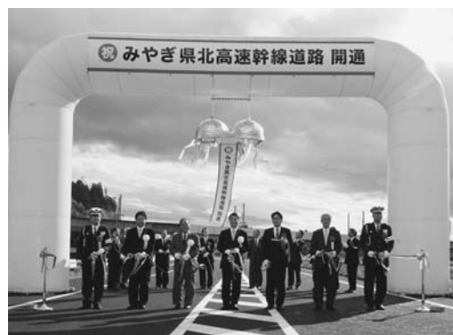
▲みやぎ県北高速幹線道路の第1期工事区間全面開通(11月24日)