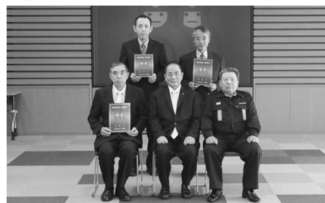
市内 ▲今回新たに表示証の交付を受けた3事業所の皆さん

地域の消防防災力を充実強化するため、平成22年度から「栗原市消防団協力事業所認定・表示制度」を実施しています。このたび、消防団活動に積極的に協力いただける事業所として、新たに3事業所を認定し、表示証の交付を行いましたので、紹介します。