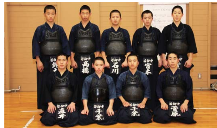
若柳中学校剣道部