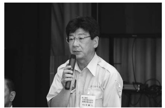
▲南三陸町の佐藤町長が御礼のあいさつのため来庁(8月19日)