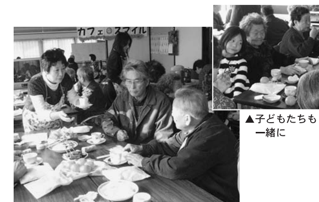
▲子どもたちも一緒に