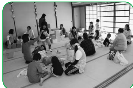
▲支援センターのおもちゃで自由に遊べませ