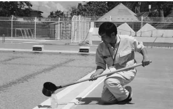
▲保育所、幼稚園、小中学校で、空中放射線量とプール水の測定を開始(6月9日)