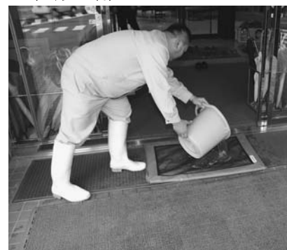
▼高病原性鳥インフルエンザ対策として消毒用除菌マットを配布(2月25日)