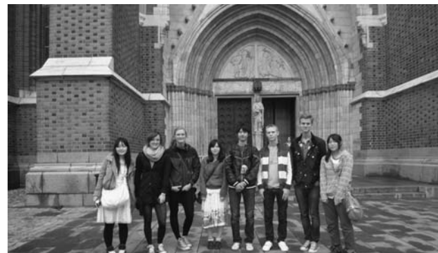
▲市内の高校生4人をオーロラ大使として派遣(9月17日〜24日 スウェーデン)