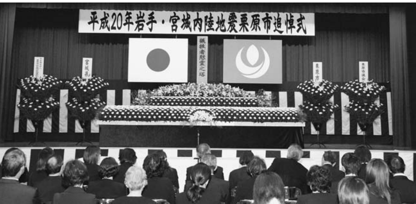
▲平成20年岩手・宮城内陸地震の追悼式(6月14日 みちのく伝創館)