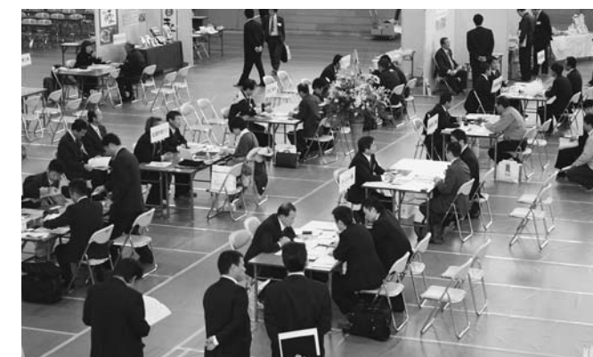
▲多くの企業が集まり、活気あふれる商談会となりました