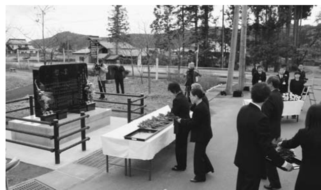
▲岩手・宮城内陸地震の慰霊碑を建立(11月9日 花山地区)