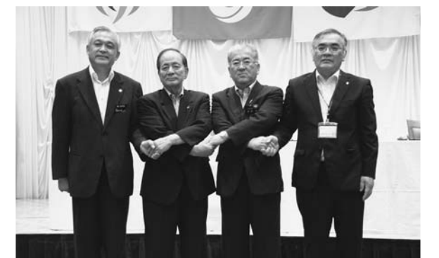
▲栗駒山ろくの湯沢市・栗原市・一関市・東成瀬村が、共同で観光を推進するため、協定を締結(7月7日)