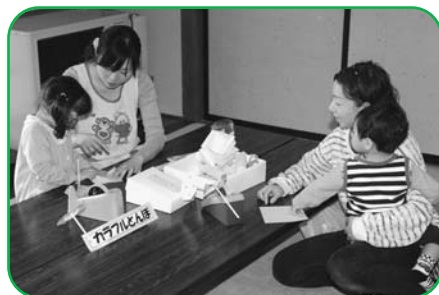
▲保育士と一緒におもちゃを作れませ

※写真は「くりはらキッズ&健康まつり」での、子育て支援センター体験コーナーの様子です