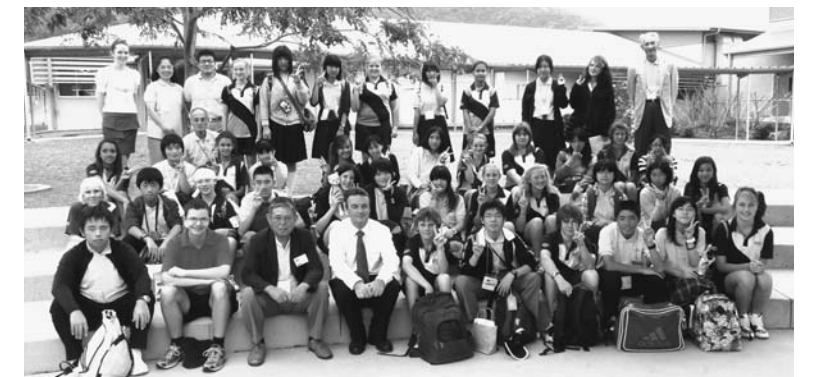
▲青空大使派遣事業に市内の中学2年生20人が参加(8月1日〜6日 オーストラリア)