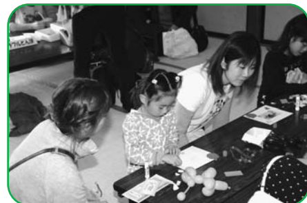
▲工作や手遊びなどを親子で楽しめませ

毎日の育児に疲れを感じている・・・、子育て仲間がほしいな・・・。そんなときは、子育て支援センターに遊びに来てみてください。支援センターは、親子が安心して触れ合える場です。子育てのアドバイスもします。