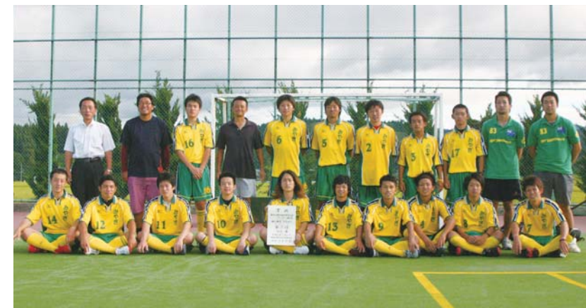
宮城県成年男子ホッケーチーム(築館・一迫地区出身者で構成)

□ホッケー(成年男子) 10月6日(木)~10日(月)/山口市・山口きらら博記念公園多目的ドーム