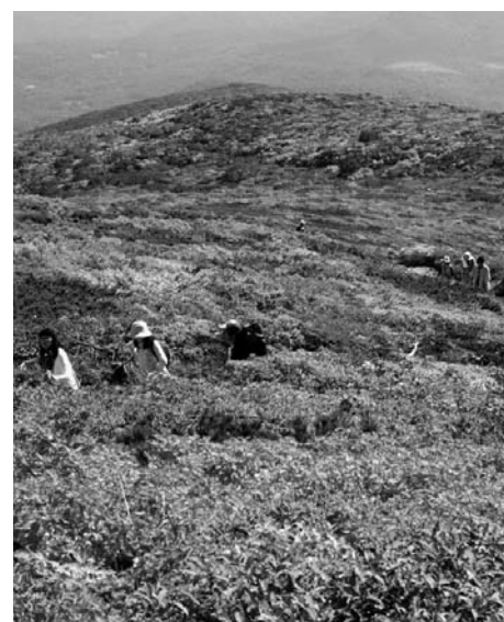
▲紅葉に包まれるように散策できます (中央登山コース)