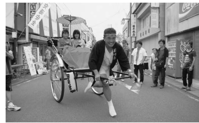
▲威勢良く口上を述べ、さっそうと走る人力車もたちまち人気者に