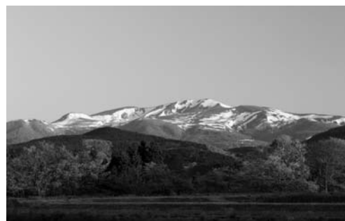
【注意】掲載している写真はイメージです。被写体を特定しているわけではありません。

秋田県、宮城県、岩手県の3市1村にまたがる栗駒山の豊かな自然資源、動植物、温泉、歴史や文化など、多彩な魅力を掘り起こし、その紹介を通じて誰もが栗駒山を訪れてみたいとなるような、魅力あふれる作品を募集します。