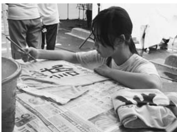
▲Tシャツに絵墨で自由にデザイン