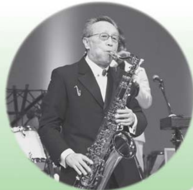
友情出演: 原 信夫と シャープス&フラッツ