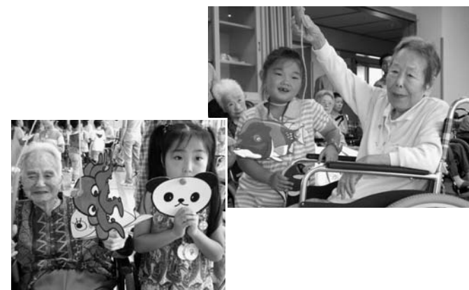
▲子どもたちと一緒に魚釣りを楽しみました