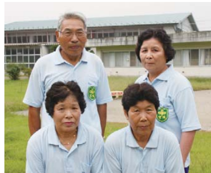
みやぎ白鷺チーム(鷺沢地区出身者)