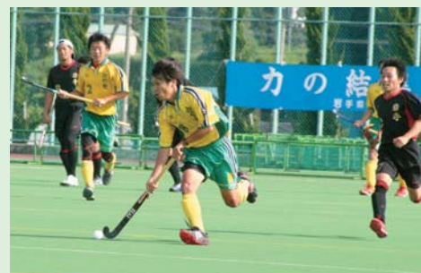
▲強敵の岩手県チームを相手に、果敢に攻め込む宮城県チームの選手

栗原市は、平成22年、宮城インターハイでのホッケー競技開催が決定した平成元年にさかのぼります。インターハイに向け、築館と若柳の4高等学校にホッケー部が発足。以来、選手の育成や施設整備などが進められ、平成13年みやぎ国体では、栗原をメイン会場とした唯一の競技大会として成功を収めました。競技力も向上し、築館中女子、一迫中男子チームが全国制覇を達成。22年前にゼロからスタートした未知の種目「ホッケー」は、多くの関係者のたゆまぬ努力によって普及・定着し、今日では栗原を代表する競技スポーツとして位置づけられ、全日本チームでも栗原市出身の選手が活躍しています。そして今年、国体の東北ブロック大会では、