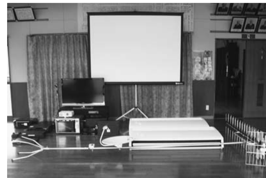
▲上照越区会(築館地区自治会)の備品一式