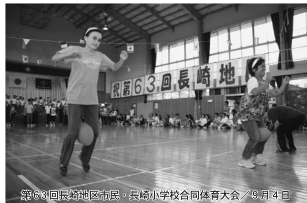
第63回長崎地区市民・長崎小学校合同体育大会／9月4日