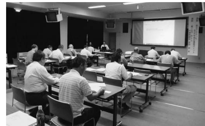
▲事業継続の重要なポイントを講演いただきました