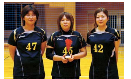
宮城ドリームス (一迫・瀬峰地区出身の3選手が出場)