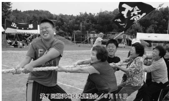
第7回鶯沢地区大運動会／9月11日