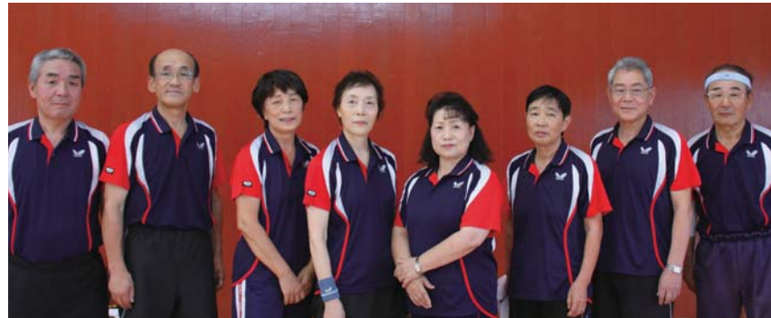
チーム栗原(築館・志波姫地区出身者)