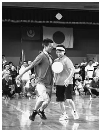
鳥矢崎地区市民運動会／9月4日