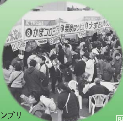
グルメグランプリ