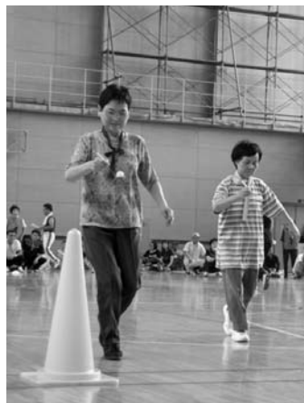
岩ヶ崎地区市民大運動会／9月4日