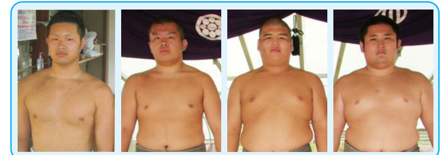
宮城県相撲少年男子チーム(栗駒地区出身の4選手が出場)