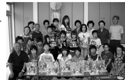
▲卓上に飾れる七夕飾りを作りました

和紙を使った七夕人形作りや、昼食を囲みながらの地域交流会で、夏休みの楽しい思い出を作っていました。