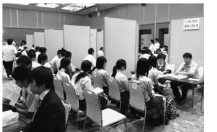
▲19社の説明ブースが並びました

説明会には、市内など23校から112人が参加し、就職に向けて企業からの説明を熱心に聞いていました。