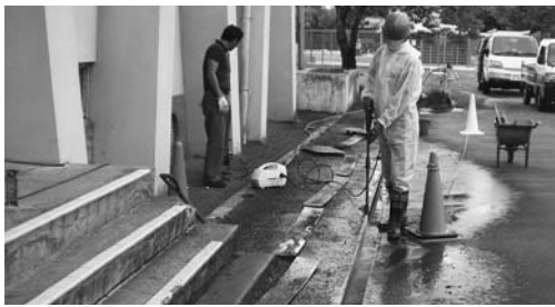
8月19日から側溝などの除染作業を実施しています

ト/時を超える数値を確認しましたので、学校の夏休み中に刈草を土中に埋めたり、土壌の入れ替えや高圧洗浄機による除染作業を行っています。今後も、敷地内の放射線量が高く出るポイントを調査しながら、1マイクロシーベルトを超える場所があった場合には、不安を取り除くため、除染作業を行うこととしています。