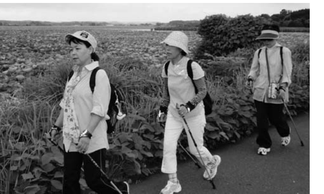
▲ハスが一面に広がる伊豆沼のほつりをウォーキングしました