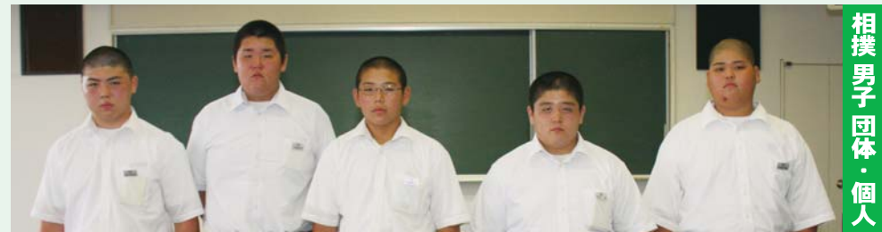
相撲 男子 団体・個人

8月12日(金)～15日(月) / 京都府丹波町・グリーンランドみずほホッケー場