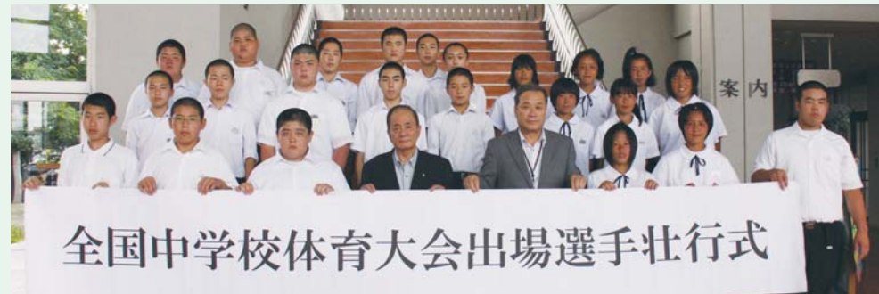
▲全国中学校体育大会に臨む選手の皆さん

8月17日から開催された、全国中学校体育大会出場選手の壮行式が8月9日、栗原文化会館で行われました。選手たちは、辛い練習や震災に耐えて培ってきた自分たちの力を、十二分に発揮することを胸に誓いました。