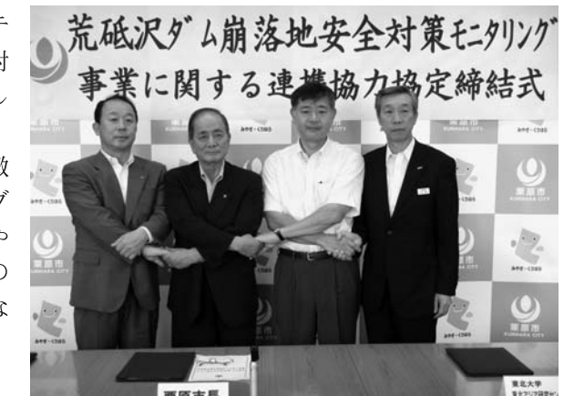
▲ 4者で協定の締結をしました

この協定は、平成20年岩手・宮城内陸地震の象徴的な被災現場となった荒砥沢ダムの崩落地を、レーダーシステムや高解像度カメラで監視し、新たな崩落や山岳災害を事前に検知・発見することにより、周辺の民家や道路などの地域の安全対策に役立てる内容となっています。