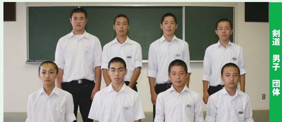
剣道 男子 団体