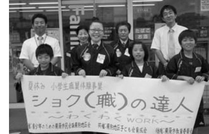
▲本物の店員さんと変わらない仕事を体験