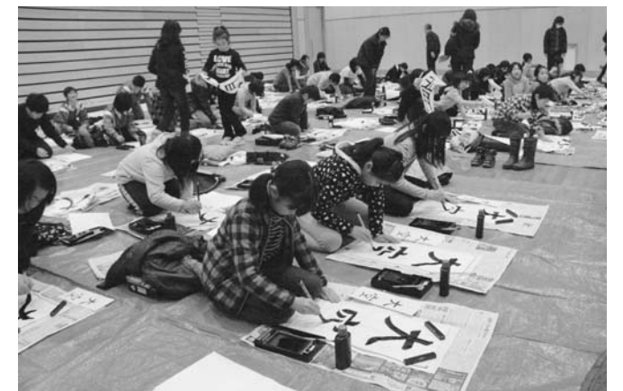
▲参加者は、大人顔負けの素晴らしい字を書き上げていました

「うた」「大空」「世界」「希望」「無限」など、学年に合わせて用意された課題は、どれも新しく始まった1年に期待と希望を抱く言葉ばかり。参加者は、年頭の引き締まった気持ちで真剣に、一筆一筆に新年への願いを込めながら、思い切りよく筆を走らせていました。