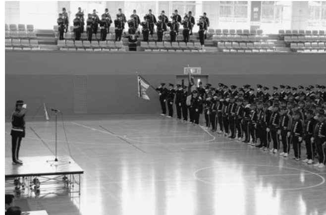
▲約800人が参加して行われた出初式

消防団長と消防長から、あらゆる災害に備え、連携を取りながら業務にあたるよう訓示がありました。