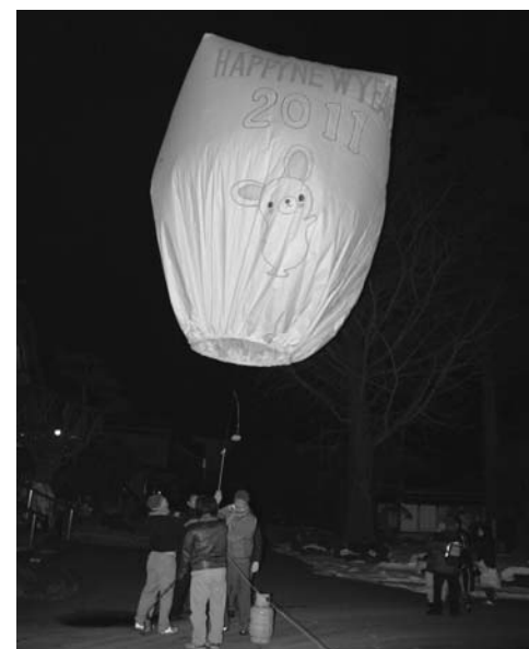
▲空高く揚がった手作りの紙風船

今年で8年目を迎えたこの行事。紙風船にとろせましと書かれた老若男女の願い事は、ボランティアの皆さんの手で天高く舞い上がりました。