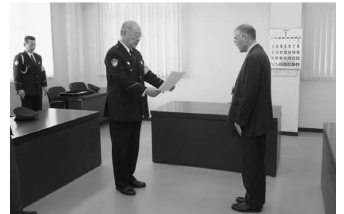
▲築館警察署長(中)から感謝状を受け取る志波姫総合支所長

志波姫地区では平成20年4月12日以降、今年1月25日現在まで交通死亡事故ゼロが続いています。