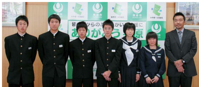
▲世界を相手に3位に輝いた皆さん

選手の皆さんは「今回の素晴らしい経験を後輩に伝えたい」「どんな状況にも対応できる、本当に日本代表と呼べる選手を目指して頑張りたい」と、これからの意気込みを聞かせてくれました。