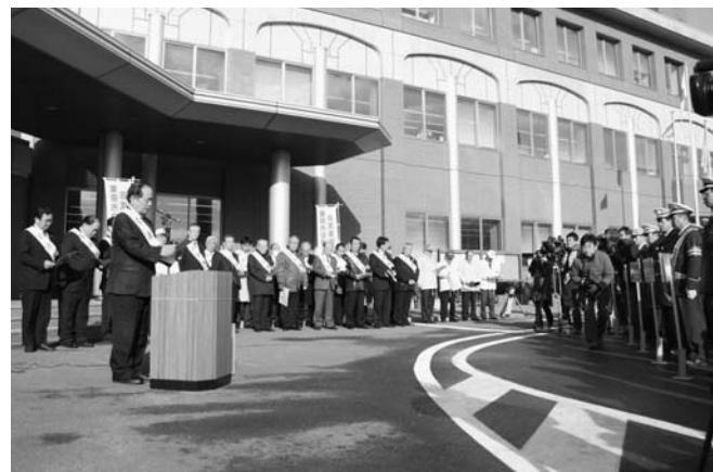
▲出動式で、市長から非常事態宣言が発令されました