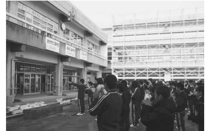
▲思い出がたくさん詰まった校舎に、感謝のエールを送りました

新校舎の完成は平成24年2月の予定で、生徒たちは完成まで仮設校舎で学校生活を送ります。