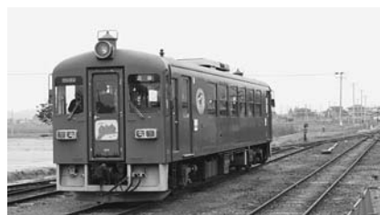
▲6月13日(日) 情緒あふれるくりでんの乗車会に多くの方が来場しました

栗原市誕生から5周年を迎え、「市民が創る くらしたい栗原」の実現に向けて、栗原市が一丸となって取り組んだ2010年を、1月から振り返ります。