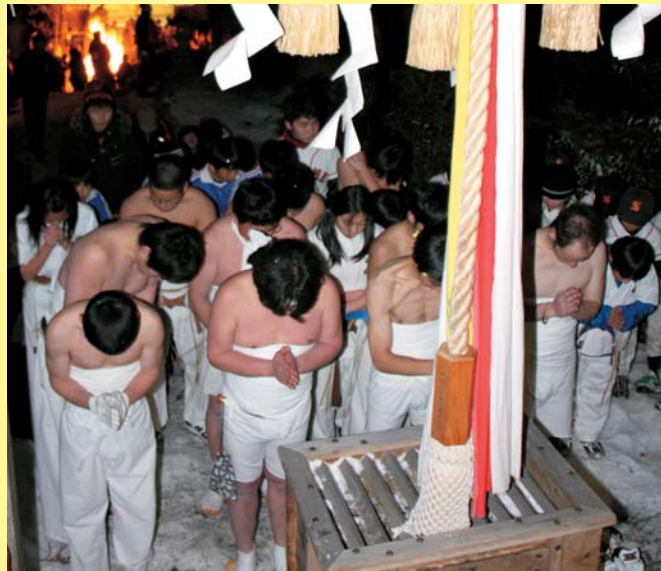
▲平安時代から続く瀬峰八幡神社に1年の必勝を祈る参加者