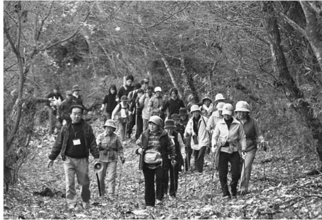
▲ふかふかの落ち葉の上を歩きました

すがすがしい気持ちでウォーキングをした後、芋だんご汁や地元のお米で作ったおにぎりを食べ、栗原を満喫しました。