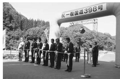
▲9月18日(土) 国道398号が全線開通しました