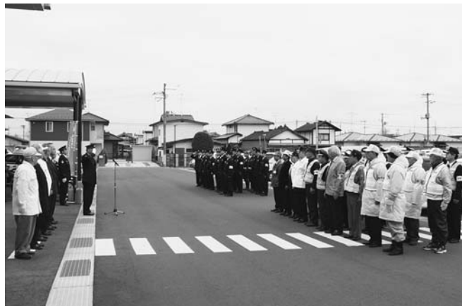
▲安心して新年を迎えられるよう、市内の安全を守ります

昨年12月13日に開かれた出動式には、市築館地区防犯協会連合会、市若柳地区防犯協会連合会や市内の自主防犯ボランティア団体、築館・若柳警察署員の皆さんなど約100人が参加。防犯意識を高め、お互いの連携強化を確認し、まちの安全を守るため出動しました。