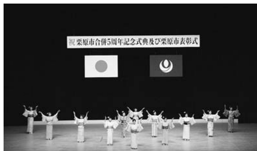
▲7月31日(土) 栗原市が誕生してから今年で5周年を迎え、各分野で功績のあった方を表彰し、また、震災復興に尽力いただいた方に感謝状を贈呈しました。 記念式典では、さまざまな団体の華麗なアトラクションが披露され、式典に花を添えました