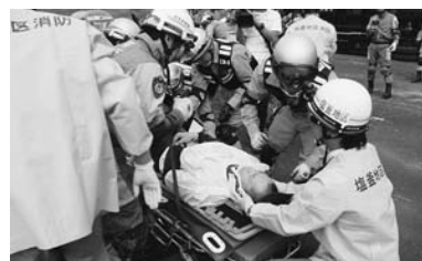
▲9月1日(水) 大規模災害に備え、被災を経験した栗原市ならではの、大規模な総合防災訓練を実施しました