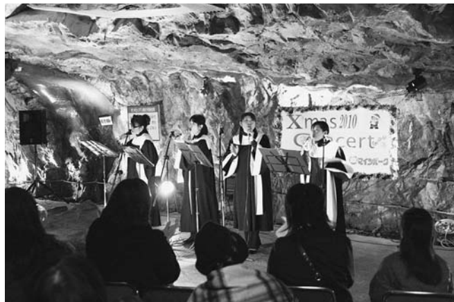
▲幻想的なステージに楽しい歌が響きました

今年は、大崎市を中心に活動するJOYCEの皆さんが出演。クリスマスソング「サイレント・ナイト」や「サンタが街にやってくる」など12曲を楽しく歌い上げました。