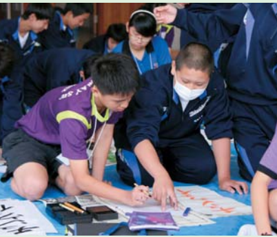
▲クイーンズウェイ・セカンダリー・スクールの研修では、中学生と書道体験をしました

これまで栗原市では、少しでも多くの子もたちが異文化に触れ、豊かな感性と広い視野を持つてもらえるよう、市内の中学2年生を対象とした青空大使派遣事業を実施してきました。今年度は、オーストラリアの中学生と学校交流を図り、異文化理解の重要性を知る機会としています。 また、市から派遣するだけではなく、海外からの受け入れもしており、今年の6月には、シンガポール共和国のクイーンズウェイ・セカンダリー・スクールの生徒が栗原市を訪れ、ホームステイなどさまざまな交流を図りました。 さらに今年度から高校1・2年生を対象に、オーロラ大使訪問団として、スウェーデン王国への研修派遣を実施します。この事業は、瀬峰地