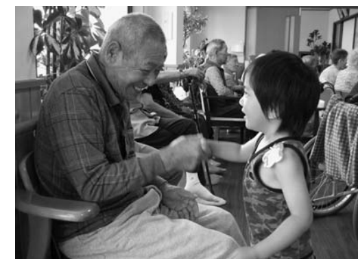
▲優しさ溢れるふれあいのひとときを過ごしました

この日を本当に楽しみにしていたおじいちゃん、おばあちゃん。そんなびーちゃんたちを無邪気に楽しませてくれる園児たち。何とも言えない世代を超えたふれあいから生まれる気持ち、すばらしいひとときになりました。