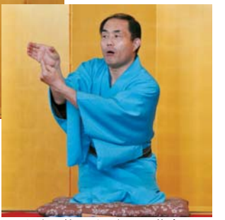
▲手話で落語を話した満腹さん