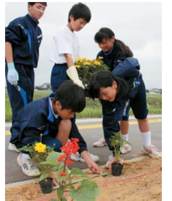
▲3種類の花を植えました

志波姫中学校の生徒166人が、児童生徒健全育成ボランティア「アルカス」の活動の一環として、校舎前からくりこま高原駅に延びる市道の緑地帯約500mに2,200本の花を植えました。