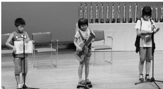
▲思い思いの表現方法で“観客に伝わる朗読”を発表しました