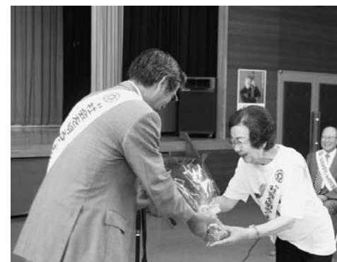
▲更生保護の象徴花「ひまわり」の花束が市へ贈られました

犯罪や非行を防止し、過ちをした人の立ち直りを地域で支えていく「更生保護」。60回目を迎えるこの運動は、更生保護について一人一人ができることを見つけ、具体的な行動を起こすことを目的としています。