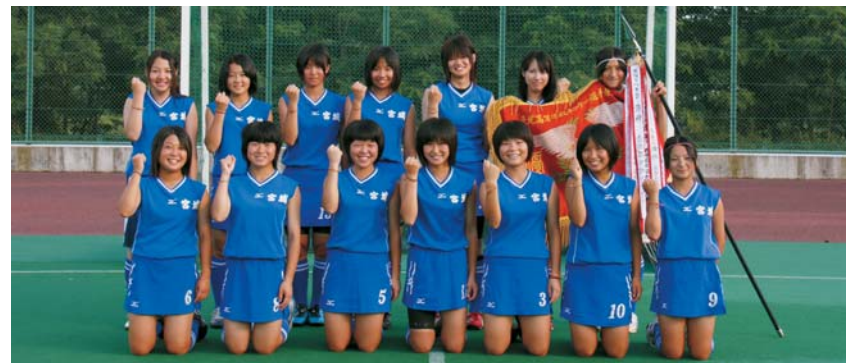
築館高等学校ホッケー部(女子)