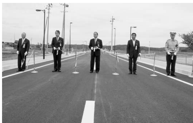
▲テープカットで開通を祝いました

また、交通混雑の緩和や川北川南市街地でのにぎわいのあるまちづくり、産業の振興に大きな役割を果たすことが期待されています。