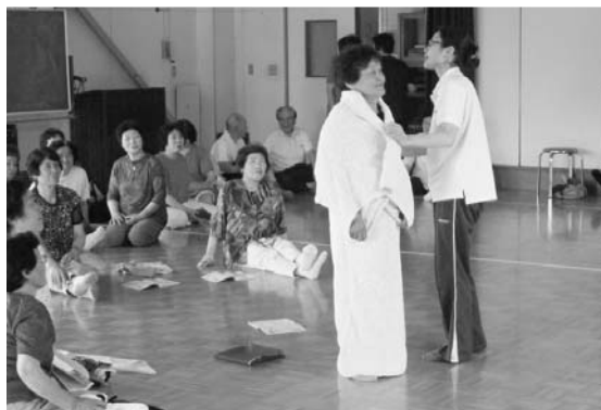
▲タオルケットを防寒着として役立てる方法も学びました

研修を通じて、災害時には地域の「団結・連携」がいかに重要か、「共に助け合い」の輪を広げることがどれほど大切かをあらためて感じさせられました。