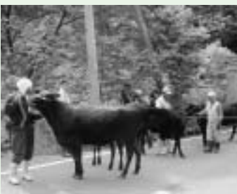
▶ 震災を乗り越えた牛