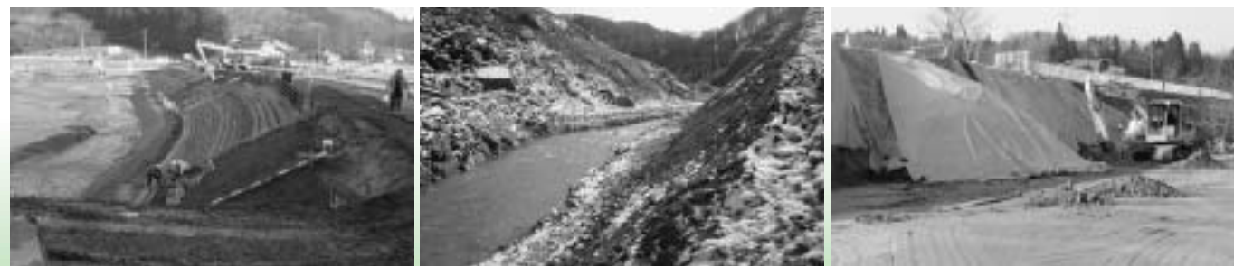
▲栗駒渡丸地区ため池堤復旧工事 ▲花山湯ノ倉仮排水路工事完了 ▲宝来小学校法面復旧工事