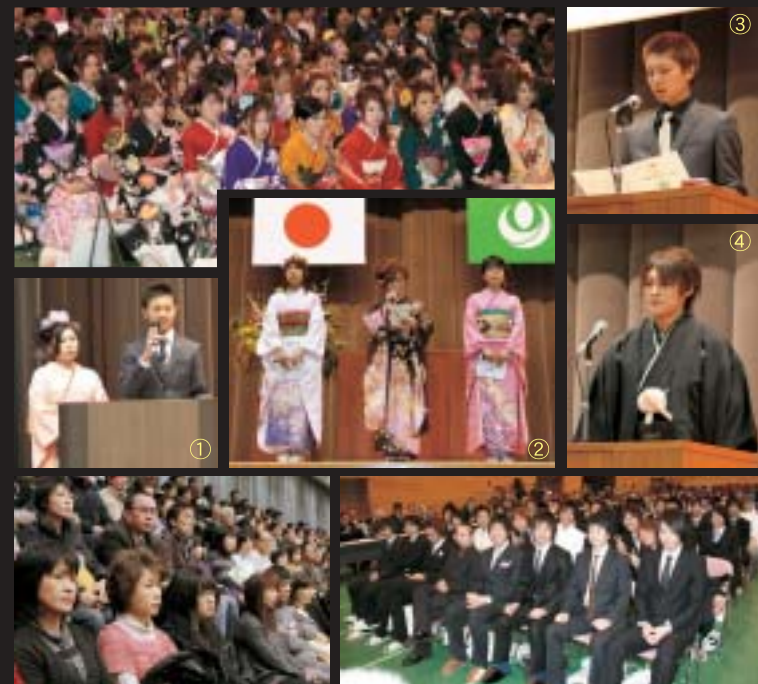
①司会 ②誓いの言葉 ③市民憲章朗読 ④閉式宣言

鶯沢細倉にゆかりのある、みのもんだ氏を迎えた記念講話では「栗原のみんなを元気づけたい。これからの未来を担うのは君たちだ。」と語り、成人者とステージ上で一緒に写真撮影をする一コマもありました。