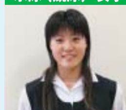
▲ 岩手県立一関第一高校水泳部 …8月17日(日)～20日(水)／埼玉県川口市・川口市青木町公園総合運動場プール