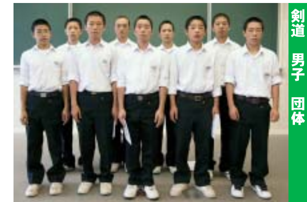
剣道 男子 団体