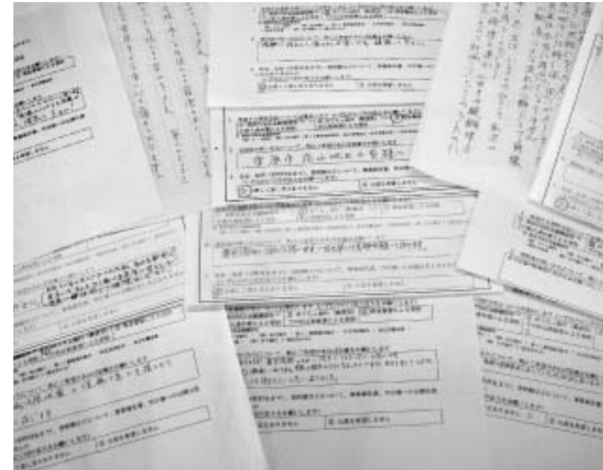
▲お送りいただいた申込書の数々