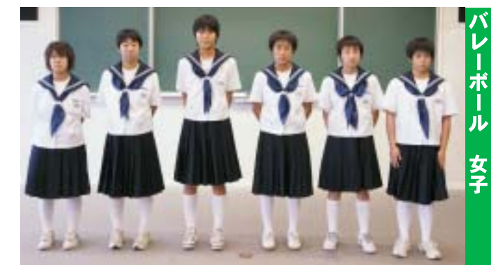
バレーボール 女子