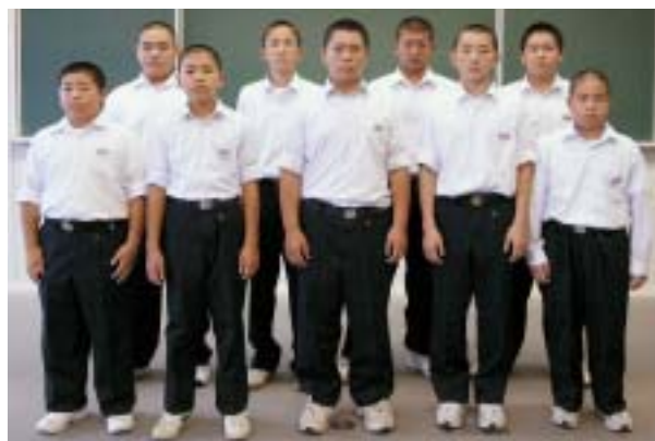
柔道 男子 団体