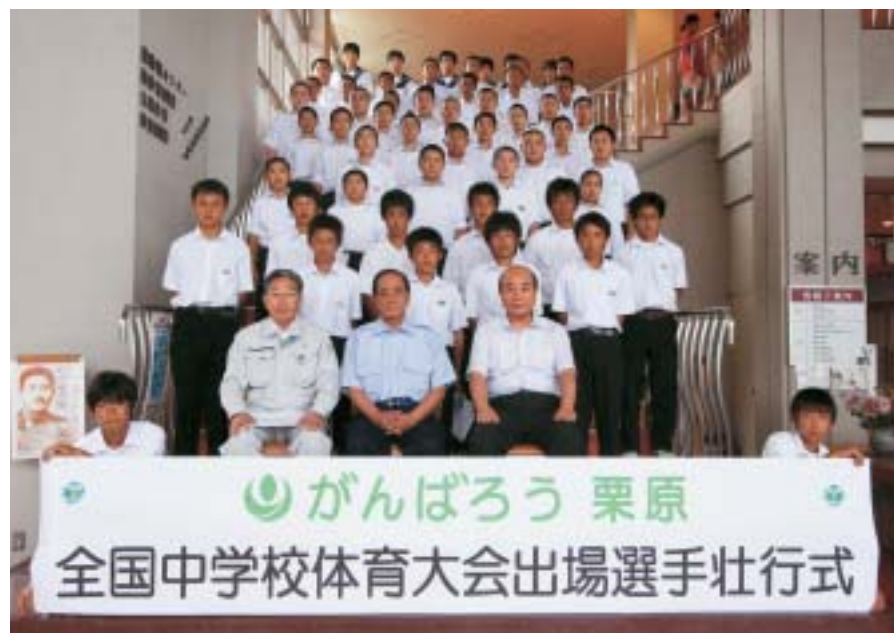
▲「がんばろう栗原」を合言葉に、市民に勇気を与えようと誓った選手の皆さん

16日から富山・石川両県で開催される全国中学校体育大会に出場する選手の壮行式が13日、栗原文化会館で行われました。 選手たちは「栗原の人たちに勇気を与えられるような試合をします」と、震災を乗り越え、被災者を励ます熱い想いを決意しました。 佐藤市長は「震災に負けず、栗原ここにありという試合を見せてほしい」と選手団を激励し、保護者や職員から見送られました。 一迫中学校バレーボール部女子は少ない部員で、練習場とする中学校体育館は震災により使用不能になりました。選手たちは、練習環境が整わない厳しい条件下でも諦めず、逆境をはねのけ見事に全国大会出場の切符をつかみ取りました。