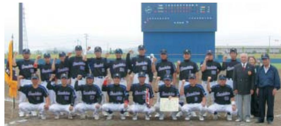
▲県大会で悲願の初優勝を決め、ガッツポーズするグランドスラム選手の方皆さん

石巻市民球場で行われた「天皇賜杯第63回全日本軟式野球宮城県大会」で、栗駒に本拠を置くチーム「グランドスラム」が初優勝しました。