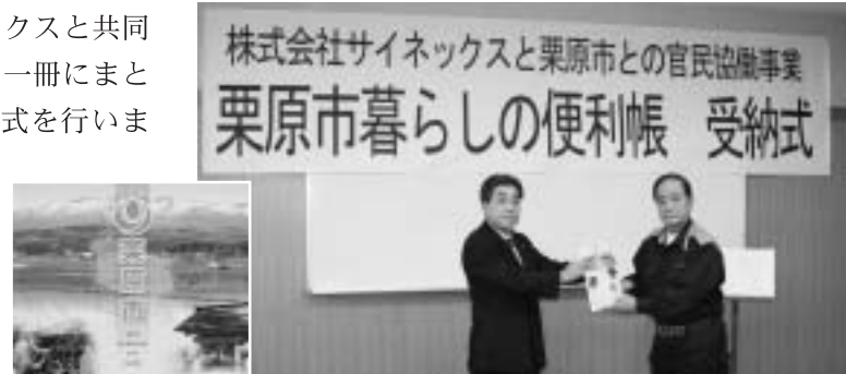
※栗原市暮らしの便利帳に掲載されている情報は平成20年4月1日現在の情報です。岩手・宮城内陸地震の影響などで掲載内容と違う場合があります。あらかじめご了承ください