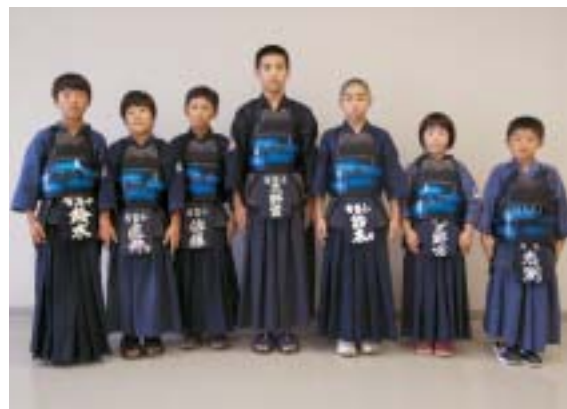
▲有賀剣道道場(有賀小学校)の皆さん