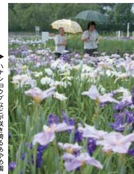
▶ハナシヨウプなどが咲き誇るあやめ園